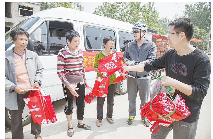
近日,漯河银监分局和郟城县商村镇银行联合开展“送金融知识下乡”骑行活动。上百名工作人员来回骑行40多公里,累计发放防范非法集资、反洗钱、反假币等宣传页1500余份。