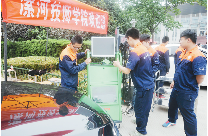
5月9日,在我市职业技能周启动仪式上,漯河技师学院汽车工程系师生向市民展示先进的“博世740”汽车检测仪,并为市民免费检测汽车故障。