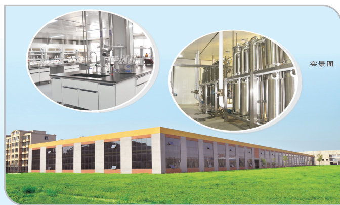
裕松源药业有限公司