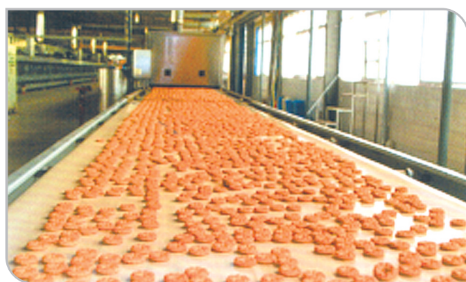
小帅才食品生产线