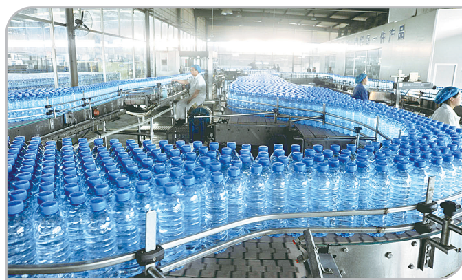
乐天澳的利饮料有限公司纯净水生产线