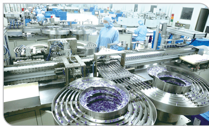
莲花医疗器械世界先进的生产线