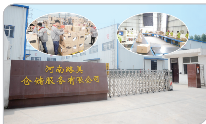
路美仓储服务有限公司