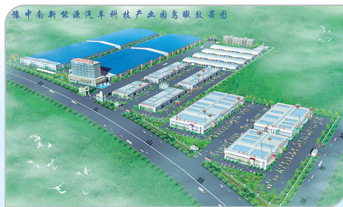
亿通集团豫中南新能源汽车科技产业园鸟瞰效果图