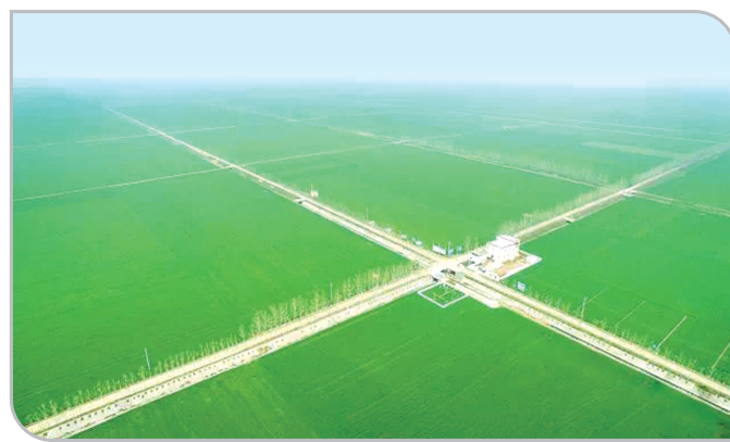
郾城区十六万亩高标准粮田