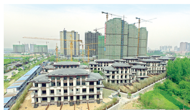
建业西城森林半岛