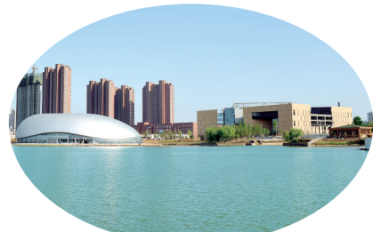
城市展示馆、群艺A馆

协调发展重统筹。 一是注重城乡协调。坚持依托城市、服务城市、以城促农,培育出沙澧春天、神农部落等农业龙头企业十余家,都市观光农业、生态休闲农业长足发展。二是注重项目带动。高铁漯河西站、中原名校北大附中相继投用,辐射漯河周边4个城市;奥特莱斯城市综合体一期工程即将试运营,高铁上的奥特莱斯将成为西城区的新名片;闽商大厦及漯河市首家保险大厦电商孵化园即将投用;天翼滨湖国际广场、畅园国际城部分已经封顶。漯河新地标市金融中心加快推进,天盛大厦、广隆大厦、拥军大厦梯次动工。邮储银行、企业总部港、绿钻国际即将开工,商务中心区建设热潮已经形成。根据刚刚公布的2015年度全省商务中心区考核结果,我市商务中心区在全省18个城市综合排序中排名第6位;在全省商务中心区绝对量指数排序中上升到第20位,较上年位次前移12位;发展指数位次上升到第7位,较上年位次前移9位。三是注重配套统筹。围绕市商务中心区加快配套设施建设,小西湖、月湾湖及音乐喷泉建成投用,看音乐喷泉、享视听盛宴成为漯河百姓休闲娱乐新体验;漯河实验小学西城校区即将招生;古城河形成景观,水韵西城特色初步显现;市中心医院西城分院、城市展示馆、博物馆、图书馆、群艺馆即将梯次投入运营;青少年实训基地、市民之家已经动工,城市功能日臻完善。土地工作卓有成效,累计报批土地6700亩;“两改”工作扎实推进,累计完成古城、胡庄、杨庄、大吴4个村、2000余户、150多万平方米征收任务,开工建设古城、胡庄、杨庄、大吴4大社区,开工安置房3300套,具备回迁条件1000套。建业西城森林半岛、天翼滨湖、畅园国际相继开盘,天悦城、阳光水城、西