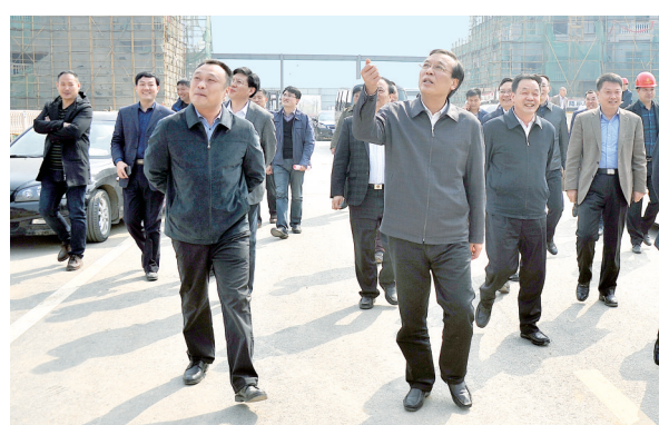
市委书记马正跃莅临西城区调研

这是一座机遇叠加乘势而上的城市新区。2010年年初,漯河市委、市政府决定依托漯河新客站、打造城市新窗口,正式启动西城区开发建设。2012年9月京广高铁开始运营,高铁朝夕至,引来商贾云集。2013年8月属地管理,尤其是2012年漯河商务中心区正式落户,形成高铁商务双轮驱动新格局,为西城区快速发展倍添动力。