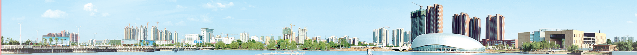
西城区月湾湖公园