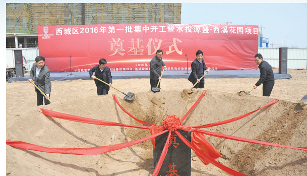
2016年项目集中开工仪式