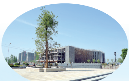
漯河市图书馆、博物馆