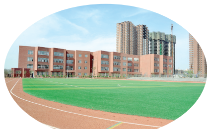
漯河市实验小学西城校区