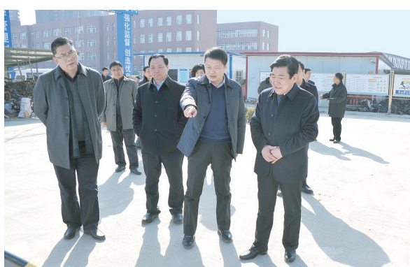
市长曹存正莅临西城区调研