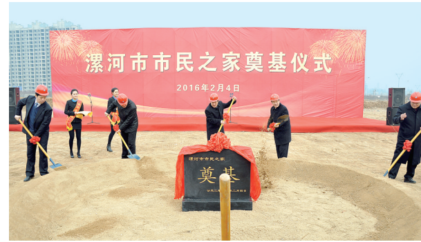
漯河市市民之家奠基仪式