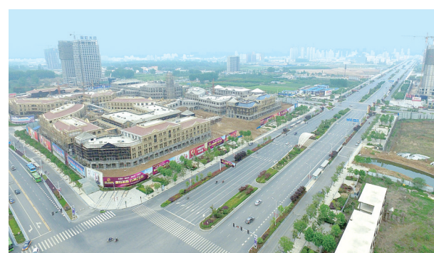
奥特莱斯城市综合体