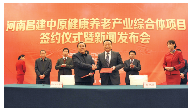
昌建中原健康养老产业综合体签约仪式