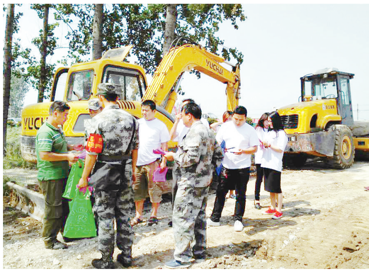
图为线路和通信安全知识下乡活动现场。

为进一步提高网络安全意识，提高群众对通信线路安全认识，近日，中国移动漯河分公司联合驻漯某部、漯河通信传输局等单位，以“保护光缆，人人有责”为主题，对漯河境内京汉广一级主备线路所经村庄开展线路和通信安全知识下乡活动。