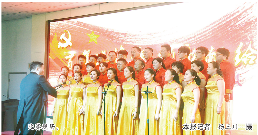
比赛现场。

本报讯(记者 杨三川)6月30日下午,市中心医院于该院会议中心隆重举办“七一”合唱比赛活动。市委组织部分副部长、市考核办常务副主任罗志民,市党教中心党员服务科科长代继英应邀观摩了合唱比赛。市中心医院院长王海蛟、党委书记王向良、副院长杨秀慧、纪检书记张丰月、工会主席刘东亮等出席了活动。