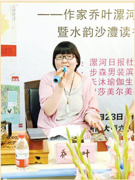
乔叶分享自己的写作与读书经验。