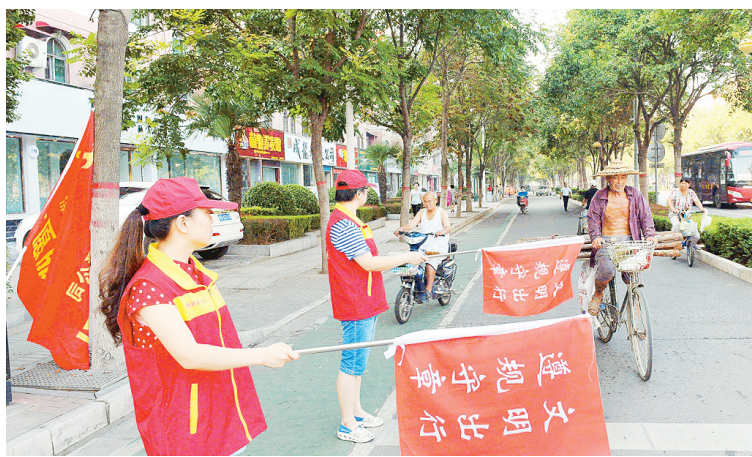
为了弘扬雷锋精神,促进城市交通的畅通、安全、有序,8月12日早上,中国联通漯河分公司党员志愿者在嵩山路和辽河路交叉口四个路口,开展文明交通引导志愿服务活动。