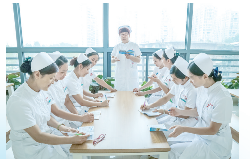
医护人员集体学习。