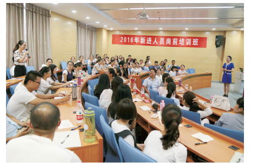
新进人员岗前培训。