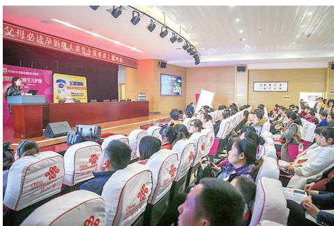
医院举办“父母共读，孩子聆听”讲堂活动。

该院还专门组织成立了“漯河医专二附院志愿者服务队”，秉承“奉献、友爱、互助、进步”的精神，以“弘扬志愿精神，奉献一片爱心”为主题广泛开展各类社会公益活动。在每年的