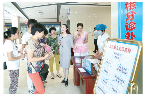
工作人员为患者讲解就诊流程。