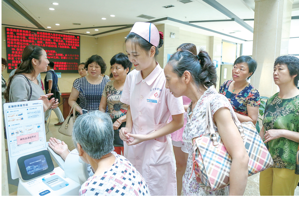
医院门诊大厅内，医护人员免费为群众测量血压。

案，为评价每个医护人员的医德医风情况提供客观依据，并于每季度在“医院信息”中公布。畅通投诉渠道，设立意见簿、意见箱、院长信箱、院长接待日，公布投诉电话，并成立接待室，负责接待处理来访及投诉。每月一次的座谈会，听取部分患者对医院工作的意见和建议。他们定期开展“服务明星”评选活动，每年5月12日护士节，召开全院护理工作