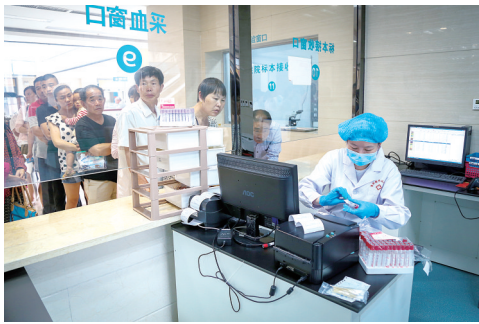
每月开展“惠民日”体检活动。