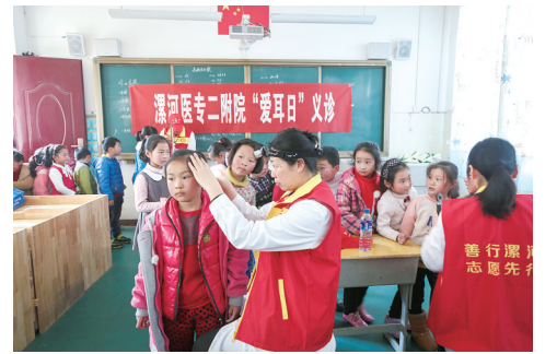
医护人员深入学校开展“爱耳日”义诊活动。