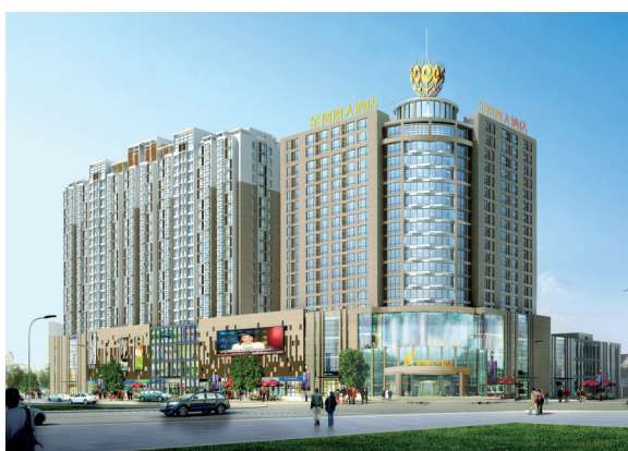
开源新城时代广场