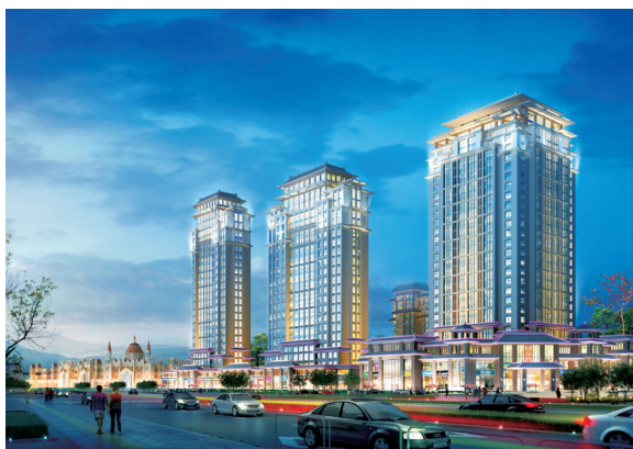
开源西城商业商务区