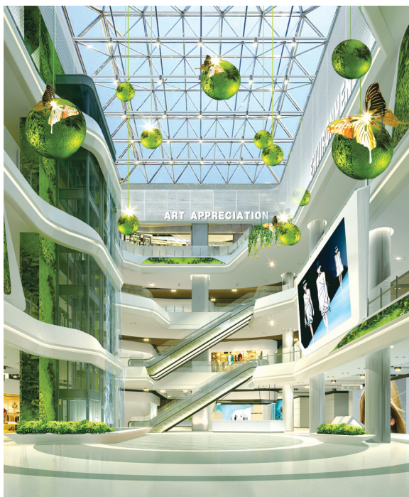
开源休闲体验式未来购物中心