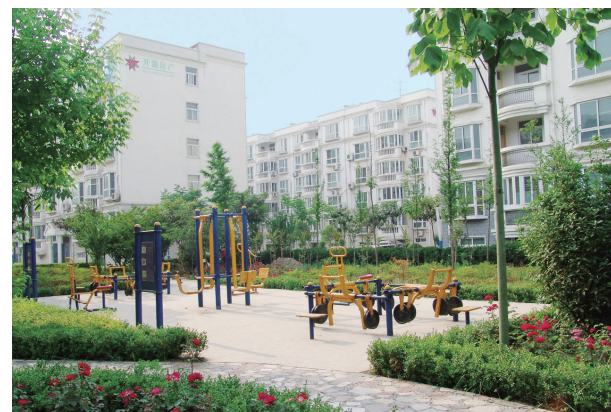
干河陈村环境优美的住宅小区