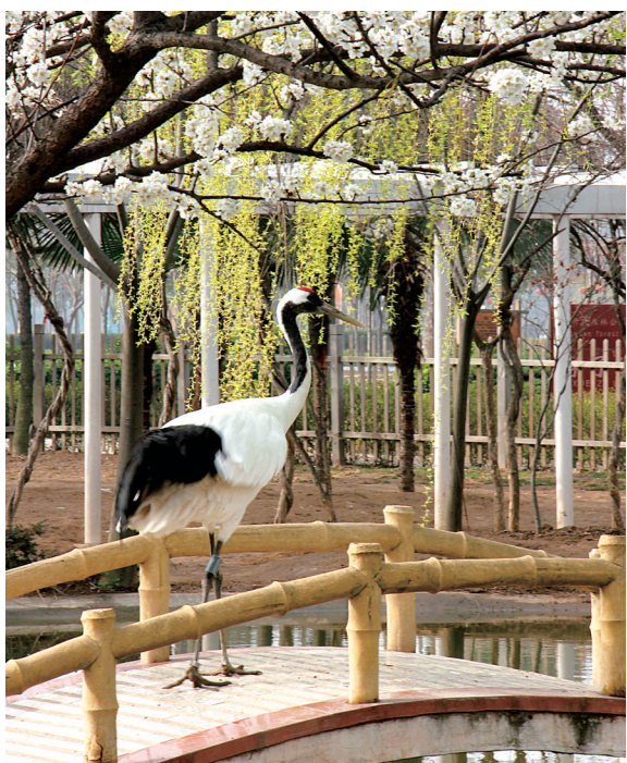
国家4A级景区——神州鸟园一景