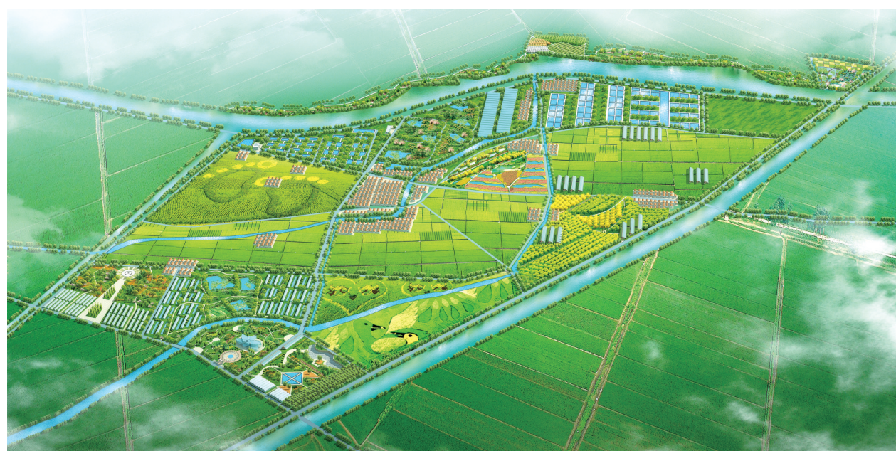
开源北城生态农业项目