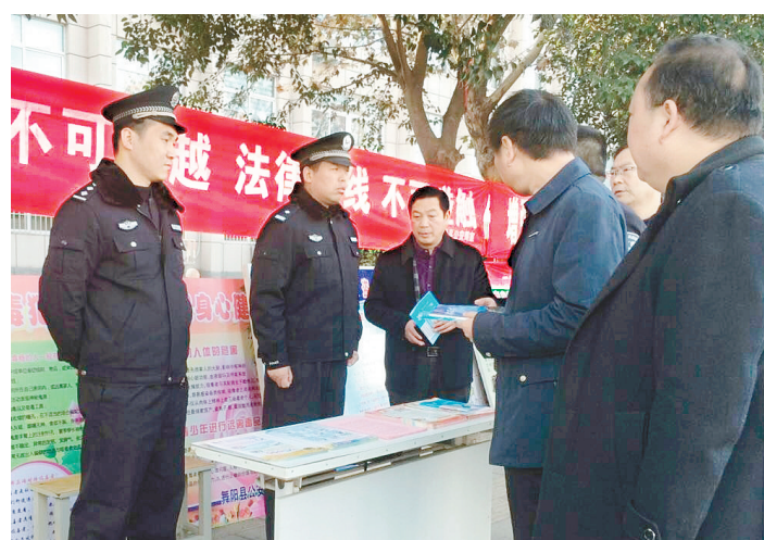
近日,舞阳县公安局在该县人民路中段设置宣传台,开展禁毒宣传。通过发放禁毒宣传册、资料等宣传方式,普及吸毒、贩毒的危害性、违法性,并介绍防范毒品的方法。