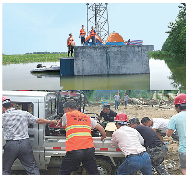
今年7月,我省特大暴雨灾区现场通信应急保障救援工作。

面增强等方面开展监测业务合作。例如:助力北京PM2.5环境指标监测,已经实现了1500个监测点的监测设备部署;与卫星定位公司合作,按照客户需求配合建设北斗卫星地面采集点站址,目前已拓展全国26个省份,建成后服务站址将接近千个。一些地方的广电部门也在积极与中国铁塔开展相关共享合作。中国铁塔公司将开放自身上百万的站点资源,立足共享,深入推进与国防、政府、社会层面的资源共享,提高资源利用率,为行业与社会创造新的更大的价值。 两年虽短,磨砺不凡;两年,风雨敲窗,光阴如梦,中国铁塔漯河分公司卓然而立。 而今,中国铁塔漯河分公司正在以和谐、开放、包容、创新的姿态,向更高水平、更高境界阔步迈进;通过“集约化、专业化、标准化”实施,满足社会需求,以精耕细作、奋发进取,踏上新的征程!