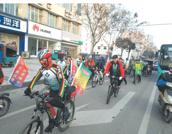
河南有线漯河分公司采用自行车骑行的方式宣传“新年送大礼”活动。

河南有线漯河分公司有关负责人表示,公司将继续提升市场化运作水平,在确保公共文化服务的质量和水平、不断提高广大人民群众满意度的前提下,不