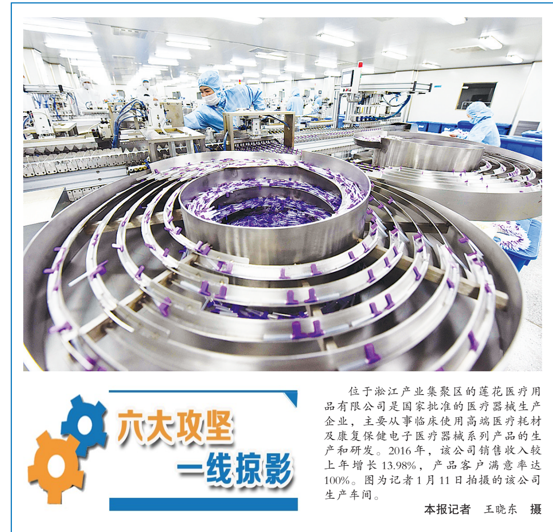
位于淞江产业集聚区的莲花医疗用品有限公司是国家批准的医疗器械生产企业,主要从事临床使用高端医疗耗材及康复保健电子医疗器械系列产品的生产和研发。2016年,该公司销售收入较上年增长13.98%,产品客户满意率达100%。图为记者1月11日拍摄的该公司生产车间。

自身历练的大考场,充分发挥模范带头作用,攻坚先锋不断涌现。截至2016年年底,市两城同创办共评出40名“攻坚之星”和12个“红旗单位”,市环保攻坚办共评出39名“攻坚标兵”和5支“攻坚先锋队”。 为确保活动取得实效,市委组织部不断完善日常管理机制,建立信息工作平台,实行“周通报、月评比、季总结”和通报反馈制度,创建手机报平台和微信工作群,定期通报活动推进情况和取得成效,每天“有图有真相”,在微信群里晒工作比成效、晒业务比创新、晒服务比满意,形成了“比学赶帮超”的浓厚氛围;积极创新活动载体,开展了“争当攻坚标兵和攻坚突击队”、“我为攻坚献良策”、“晒工作比成效”等活动,坚持向攻坚一线倾斜、向县区倾斜,更多一线攻坚人员成为引领“两城同创”、环保攻坚突破的“主力军”;持续加大宣传力度,在《漯河日报》开辟专栏,(下转2版)