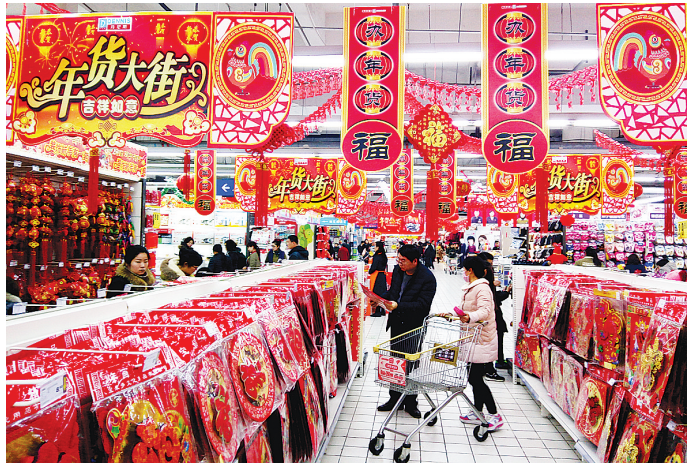
1月8日,市民在一家商场选购节日饰品。随着春节的临近,我市各大商场和超市的饰品迎来销售旺季,商家纷纷挂起中国结、红灯笼等各类饰品,迎接春节的到来。

展;统筹推进城乡建设,继续实施主城区带动战略,加快推进中心城区、产业集聚区、卫星镇、重点镇和美丽乡村建设,形成新城与老城紧密融合、乡村与城镇协调发展的新型城镇化体系;强力推进环保攻坚,大力实施“蓝天、碧水”工程,加大生态水系建设力度,强化节能减排监管,落实最严格的环境保护制度,促进环境质量明显提升。三是防风险惠民生。扎实做好民生实事,努力提高就业、养老、教育、医疗等公共服务水平,不断改善人民生活。狠抓脱贫攻坚,切实把“精准”贯穿于脱贫攻坚全过程,强化政策保障,加大财政扶贫投入力度,落实精准扶贫工作机制,做到精准识别、精准施策、精准退出、精准考核,确保年内脱贫目标任务全面完成。着力稳控各类风险,切实防范非法集资可能引发的各类社会风险,坚持最大程度保护群众利益,全力做好信访稳定、平安建设和安全生产工作,全面提高群众安全感、满意度。