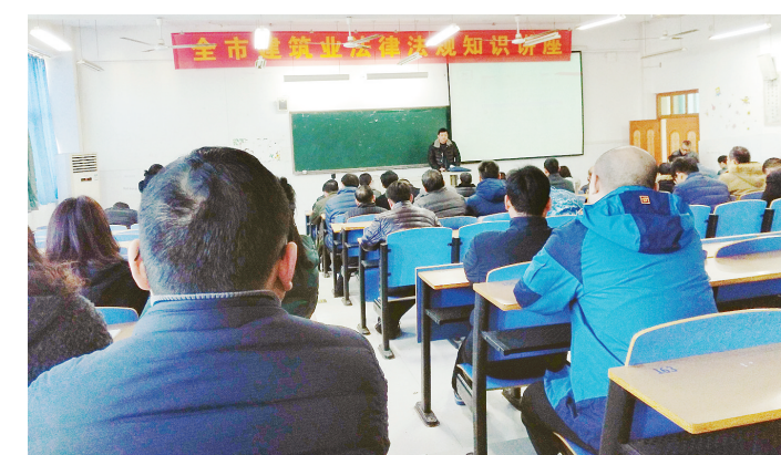
2月10日，市建筑业协会组织我市建筑企业举办免费法律讲座。

本报（记者 高海波）2月10日，市建筑业协会组织我市建筑企业开展了免费法律讲座活动，来自我市各建筑施工、监理等企业的200多位负责人参加了此次活动。