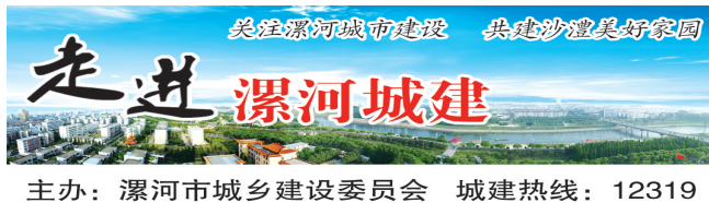
走进漯河城建 漯河市城乡建设委员会 城建热线: 12319

2016年,市公共资源交易中心受理的交易工程建设项目308宗,交易额达到38.3亿元。在今年,市公共资源交易中心将逐步推进交易全程电子化,真正实现李克强总理说的“网上全公开,网下无交易”。