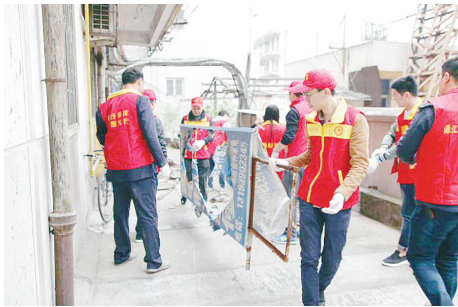
为巩固国家卫生城市创建成果,进一步改善社区居民生活环境,近日,市财政局志愿者服务队在源汇区顺河街社区开展环境卫生志愿服务活动。