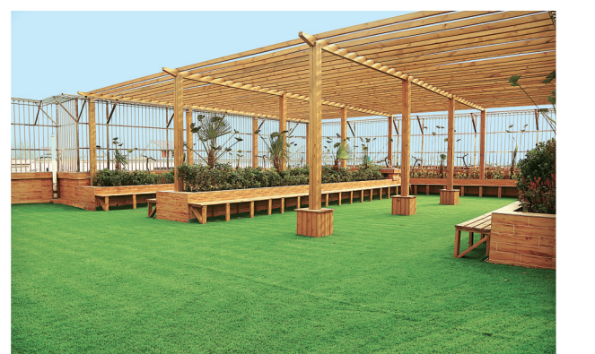
空气清新、布局合理的屋顶花园