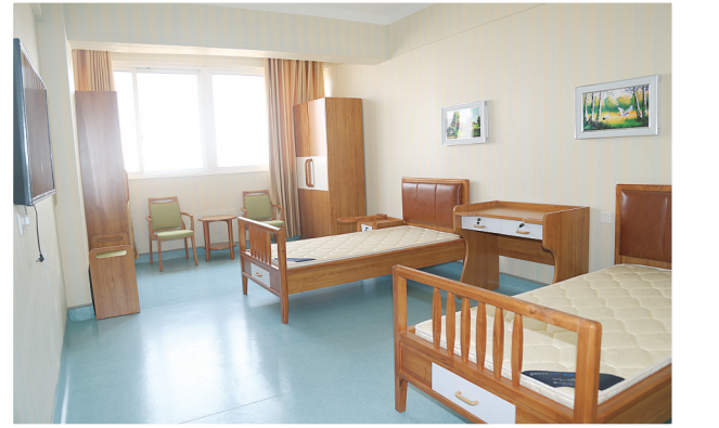
功能完善、环境舒适的养老房间