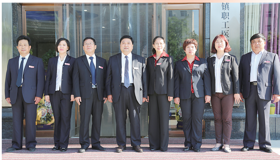
团结奋进的领导班子