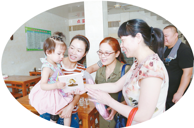
到漯河小学开展服务活动。

■文/图 见习记者 刘彩霞 为营造节日气氛,给孩子们送去节日祝福,有效地将医院人文关怀融入服务细节中,日前,市中心医院举办了主题为“共同呵护健康成长,医护同心只因为你”的形式多样、温暖人心的庆“六一”大型系列活动。