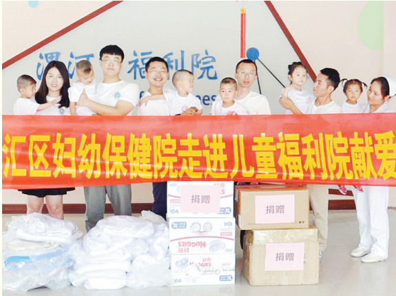
近日,源汇区妇幼保健院的志愿者到市儿童福利院,为孩子们送去了学步车、T恤等生活用品。