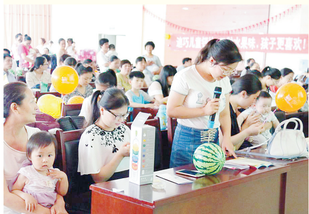
6月1日上午,市妇幼保健院在病房楼三楼会议室举办了庆“六一”大型公益育儿知识讲座暨联谊活动。