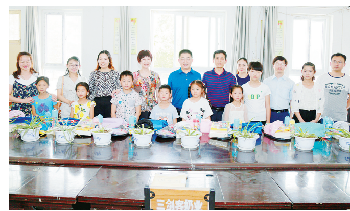
市中心医院组织志愿者到河涯李小学,为孩子们送去节日礼物。

志愿者们带着礼物走进教室,孩子们的小脸上都洋溢着灿烂的笑容。一些认识爱心志愿者的孩子们纷纷簇拥上前,向熟悉的叔叔阿姨们诉说自己的变化。看到孩子们天真、可爱