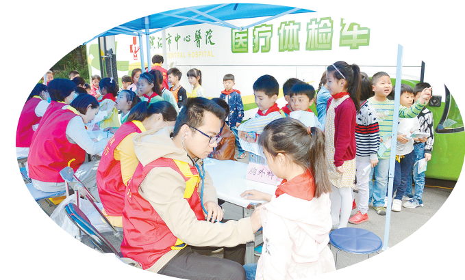
对贫困儿童进行健康回访。

与学龄儿童息息相关的健康盲点。通过视力筛查、儿童替牙期普查、先天性心脏病检查等,收集数据,再由该院体检科进行综合分析,出具健康分析报告并反馈给每一位学生家长,从而引导家