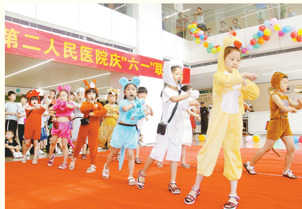
6月1日上午,市二院在门诊一楼大厅举办医患联欢会,家长和孩子们共同度过了一个快乐的节日。