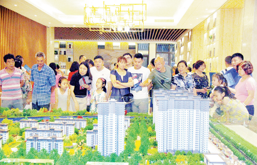
云熙府景观示范区开放活动现场人潮涌动。