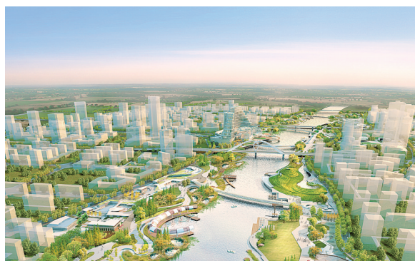
沙河沿岸景观建设工程效果图