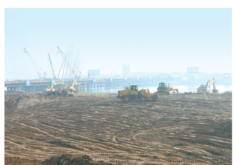
沙河沿岸景观建设工程地形处理