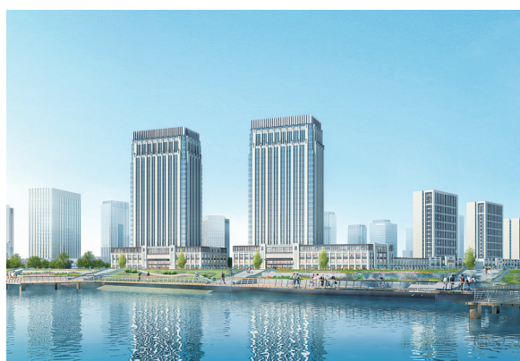
昌建总部港写字楼效果图