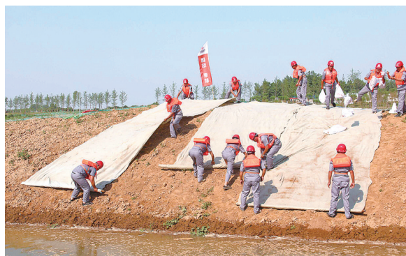
沙河沿岸景观建设工程现场