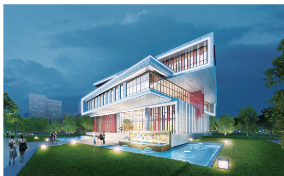
昌建总部港展示中心效果图