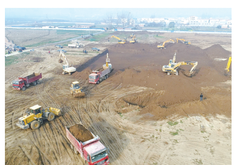
沙河沿岸景观建设工程东湖施工现场