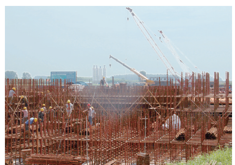
牡丹江路沙河大桥钢平台施工现场