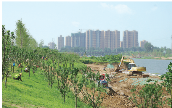
沙河沿岸景观建设工程绿化现场