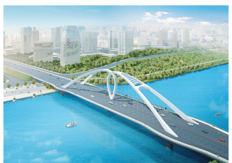
牡丹江路沙河大桥效果图