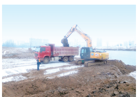
沙河沿岸景观建设工程地形处理