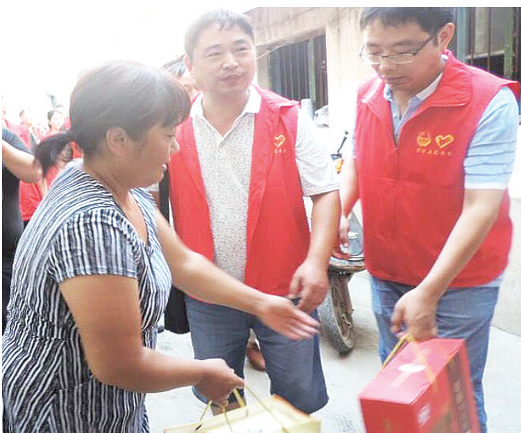
7月20日,漯河五高志愿者到帮扶村席郭村开展志愿活动。志愿者为村里的贫困户送去了生活用品,并对村里电线杆及建筑物上的小广告进行清除。