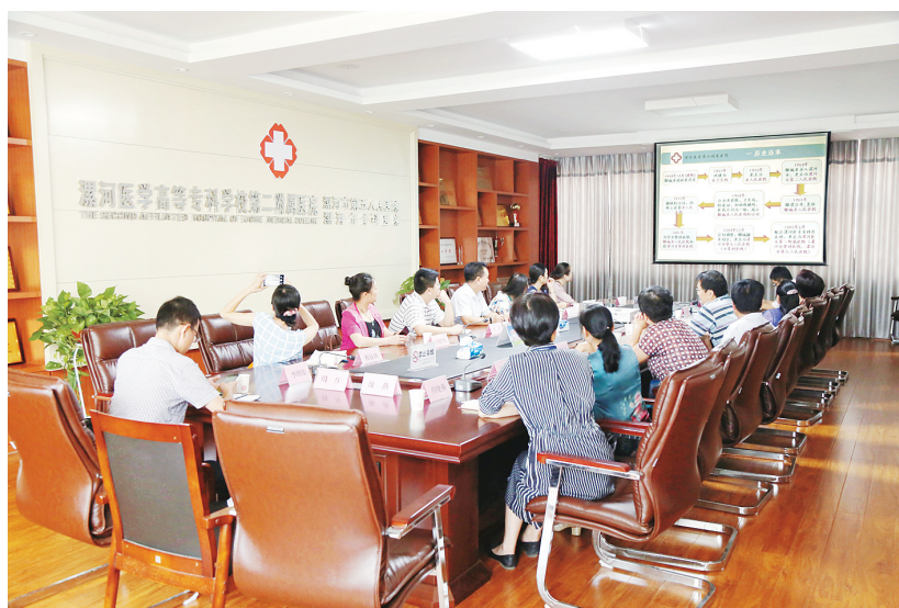
8月15日,河南省职工医院考察团到漯河医专二附院(漯河市第五人民医院、漯河市骨科医院)考察、学习公立医院综合改革工作,交流医改工作经验。