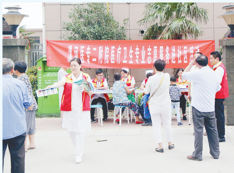
开展志愿服务进社区活动。