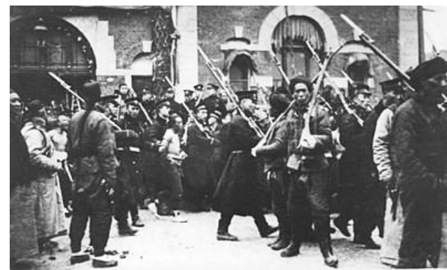
起来造反的不光有军人,还有农民。

从国人视洋人为野蛮人、视西方科技为奇技淫巧,将火车看作破坏风水的怪物,到立志扶清灭洋,将洋车、洋油、洋面、洋钉、洋胰子引入日常生活,从蔑视洋人到引进夷人之技以制夷,国人在改朝换代的时局动荡中,思想认识也在经历一场巨变。