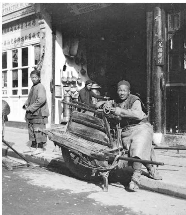
萧条的生意,迷茫的国人。

从什么时候开始与世界产生差距不重要,重要的是有了差距还不知道,或者不愿意承认,还在故步自封。到了1901年,这个依然沉浸于“帝国梦”中的清国已经破败得不能再破败了。