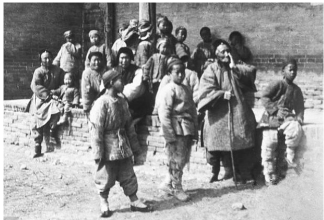
面对不请自来的洋人,没见过世面的不仅是皇宫里的那帮人,还有没见过世面的老百姓。

三是天灾裹挟着人祸,也就是常说的天怒人怨。清国末年,内忧外患,连老天爷也跟着闹别扭。查阅郾城县志,自1875年光绪元年到1911年宣统三年,郾城县的基本情况是:“光绪元年,土垆河岸陷。二年,渚河决于余湾。秋,大旱,禾歉收,麦不克种。三年春,大饥。四年,大疫。五年,风雪,大寒……。宣统元年,沙河溢,决者二年。六月溢。八月,大雨。三年春,大饥。”28年中21年是灾年。当时的漯河还是源汇寨,归属于郾城。郾城县作为中原地区的一个行政区域,是著名的粮仓之一,具有一定的代表性。事实上,清朝灭亡前的最后五十年,全国单是水灾就发生236次。最大的害河黄河平均两年决口一次。光绪丁丑(1877)年灾荒,一个山西省就死亡500多万人,占全省总人口的三分之一。