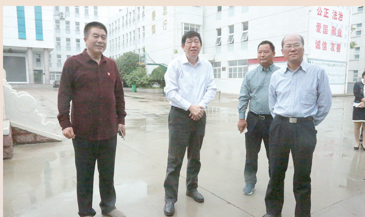
副市长栗社臣在市教育局党组书记、局长赵建利陪同下调研我市教育工作。