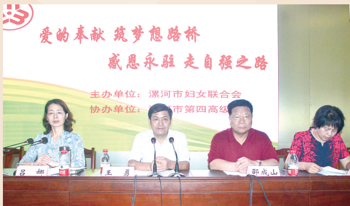
市委副书记、市委政法委书记王勇,市人大常委会副主任邵成山,副市长吕娜,市政协副主席胡新峰出席“春蕾班”揭牌仪式。