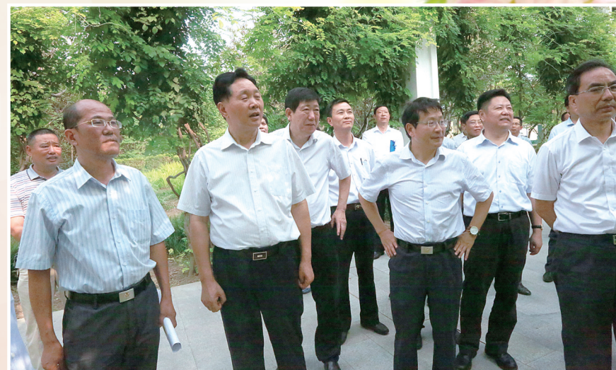
河南省教育厅厅长朱清孟在漯河市调研指导教育工作。

四是师资建设不断加强。 积极创新教师培训模式,采取校本研修、远程培训等多种模式,不断加大教师培训力度,进一步促进教师素质提升。扎实开展“国培计划”和“省培计划”,进行中小学教师继续教育专业科目的培训,培训教师2万余人次;连续10年利用暑假举办英语骨干教师培训班,邀请国外英语教育专家对我市1000余名英语教师进行集中培训,有效提升了广大英语教师的教學能力。落实省“两区”人才支持计划,精心选拔22名市直学校骨干教师到