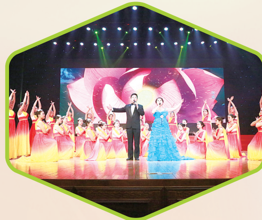
全市2017年职业教育宣传周活动精彩纷呈