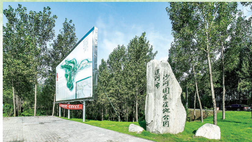
漯河市沙河国家湿地公园

为激励广大市民积极投身沙河国家湿地公园建设,日前,由漯河市林业和园林局、漯河日报社、市绿化委员会办公室、市林学会联合主办,漯河绿地(集团)发展有限公司承办的“绿地杯”“生态家园·魅力漯河”沙河国家湿地公园摄影作品征集活动隆重启动。征集活动开展以来,吸引了社会各界的广泛关注。大家纷纷拿出手中的相机,用镜头记录沙河国家湿地公园建设、绿化、野生动物保护等水天一色的美景,将湿地自然之美、生态之美、和谐之美长久定格,涌现出一大批富有活力、撼动人心的摄影作品。经过层层筛选,现将部分优秀摄影作品在《漯河日报》上刊登,以飨读者。