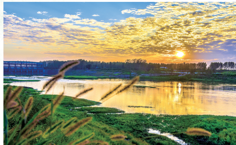
湿地晚霞

沙河国家湿地公园主体位于漯河市舞阳县境内,规划范围包括舞阳县、郾城区和源汇区境内沙河主河道,以及泥河洼滞洪区的导流河及周边区域。规划区西起舞阳县北舞渡镇军张村,东至源汇区阴阳赵镇的大张庄,北到郾城区沙河河道北岸,南至舞阳县莲花镇导流河南岸、老泥河。规划区湿地内,河流湿地386.78公顷,占湿地面积的86.00%;人工湿地63.12公顷,占湿地面积的14.00%。沙河湿地是我市最重要的湿地之一,区域内滩涂广阔,候鸟云集,是中原地区河流湿地的典型代表,对维护生态平衡、展示漯河形象、推动漯河全面协调可持续发展意义重大。