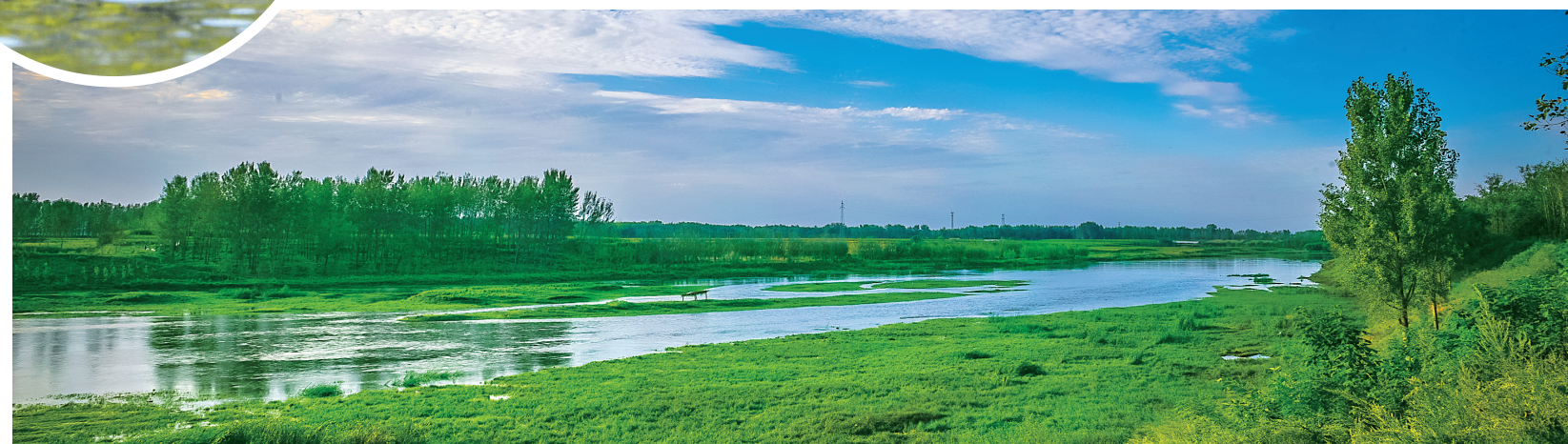
湿地生态