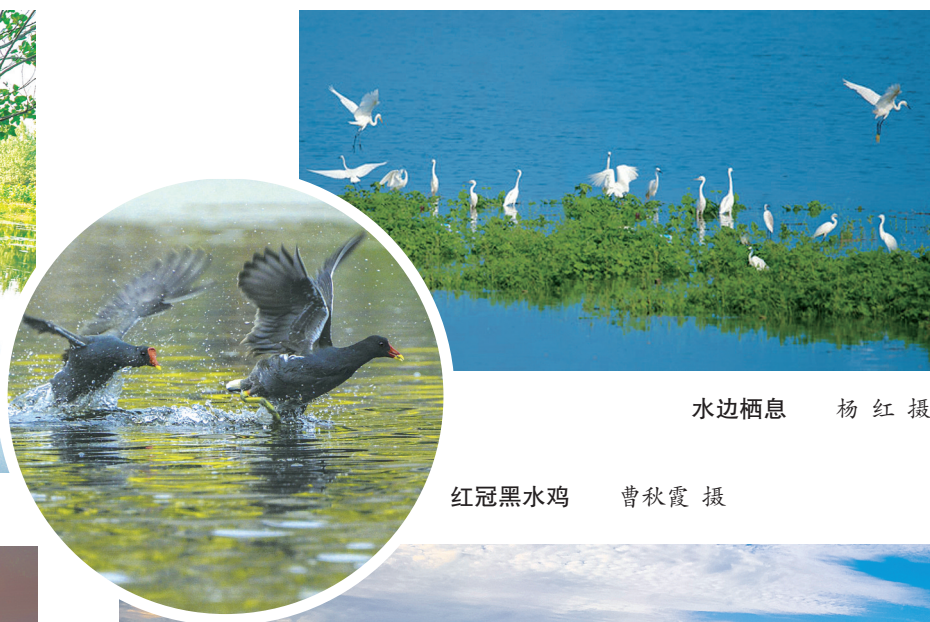
水边栖息