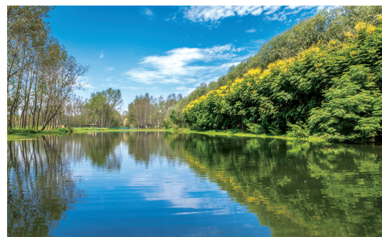
一汪清泉