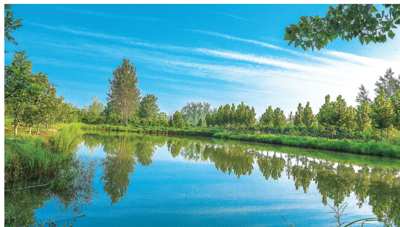
碧水蓝天