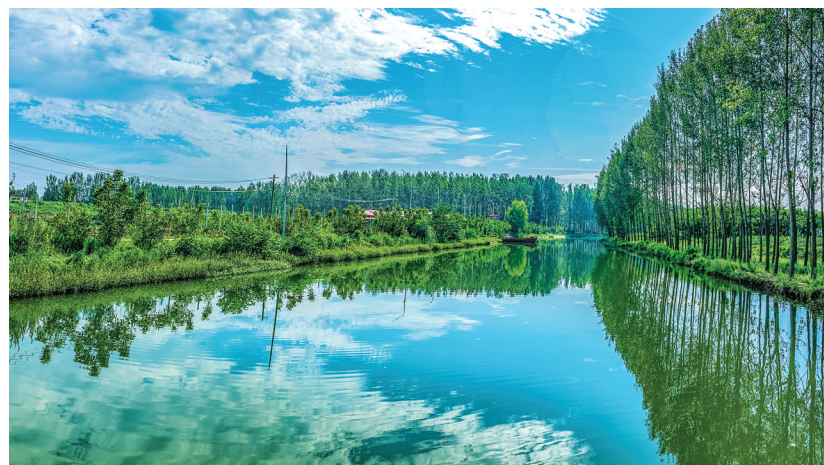
水天一色