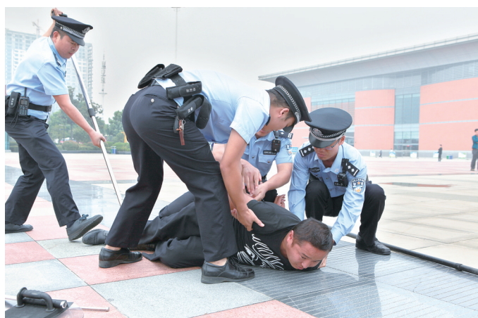
选调优秀教官到安保一线开展送教培训活动。