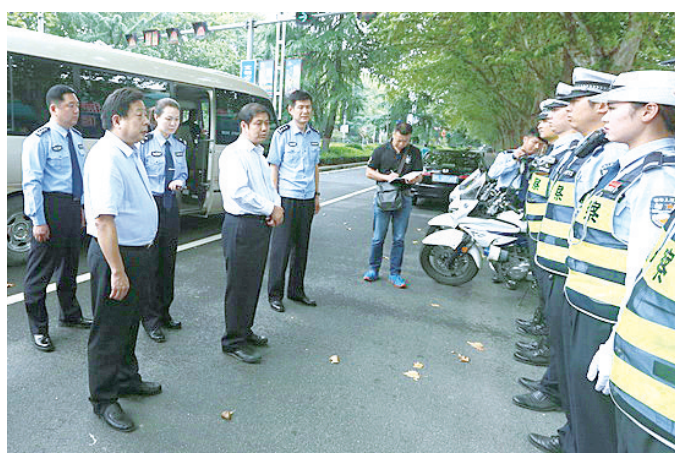
市委副书记、市委政法委书记王勇,副市长、市公安局局长李军信深入基层一线看望慰问节日期间坚守岗位的一线执勤民警。

群众过节,警察站岗。国庆、中秋节期间,全市公安民警、武警消防官兵、辅警舍小家为大家,放弃节假日休息,全员在岗、全时坚守、全力以赴,忠诚履职、奋力拼搏、连续奋战,全面加强节日期间安保工作,有力地维护了全市社会治安大局平稳,忠实践行了“对党忠诚、服务人民、执法公正、纪律严明”的总要求。据统计,10月1日至8日,110报警服务平台接报刑事案件、治安案件警情同比分别下降57.47%、50.66%;各类交通事故、受伤人数、财产直接损失分别同比下降65.32%、87.5%、55.71%;火灾、经济损失分别同比下降67%、22%,无人员伤亡。