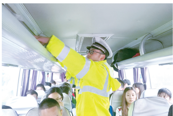
交警对过往车辆进行检查。