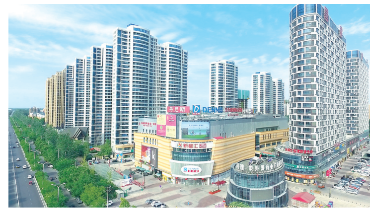
环境舒适的休闲购物中心