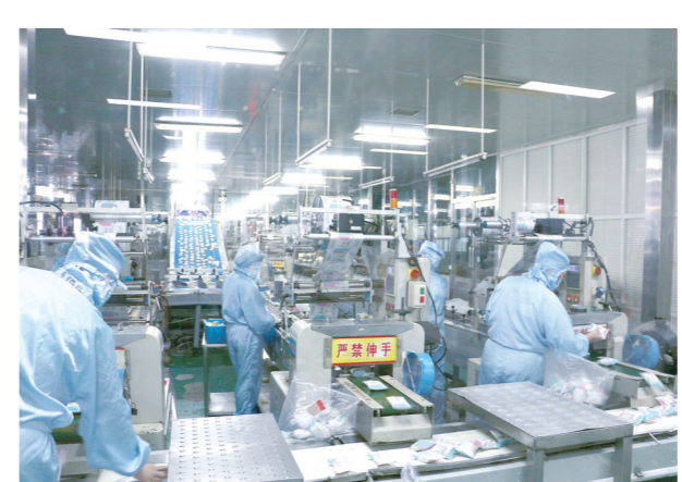
小帅才食品生产线

核心意识、看齐意识,坚决同以习近平同志为核心的党中央保持高度一致,推动中央和省、市委决策部署在郾城不折不扣落实;必须扎实推进“两学一做”学习教育常态化制度化,深入学习贯彻党的十九大精神,尤其是习近平新时代中国特色社会主义思想,不断增强“四个自信”,始终沿着中国特色社会主义道路砥砺前行。 二要坚定不移加快发展。坚持发展第一要务不动摇,更好适应经济发展新常态,牢固树立和贯彻落实新发展理念,突出抓好稳增长、促改革、调结构各项工作;始终把握招商引资作为“一号工程”,把项目建设作为重中之重,加快淞江、漯西、特色商业区三大平台建设,提升传统产业,壮大新兴产业,