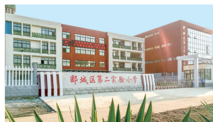
郾城区第二实验小学