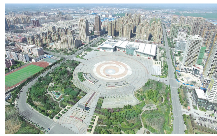
鳞次栉比的高档住宅小区