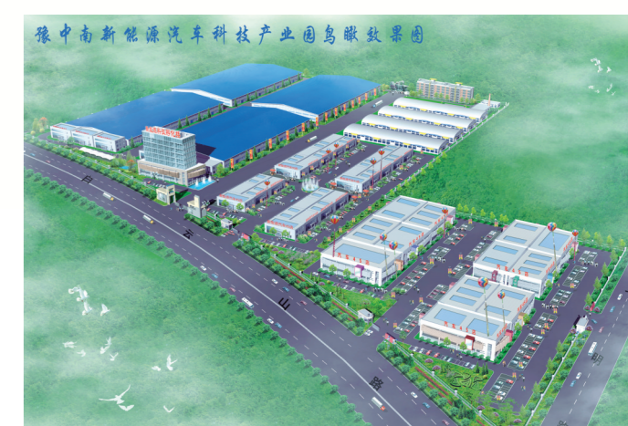
亿通集团豫中新能源汽车科技产业园鸟瞰效果图