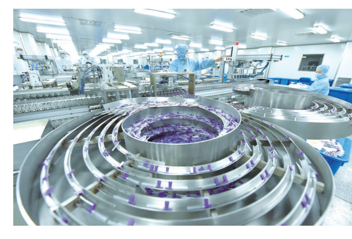
莲花医疗器械世界先进的生产线