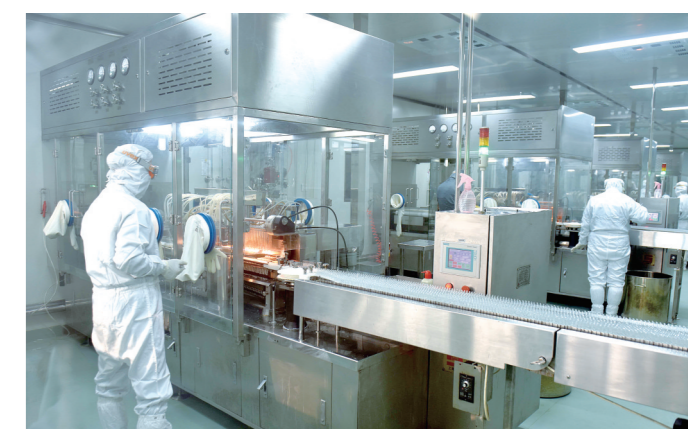
裕松源药业有限公司生产车间