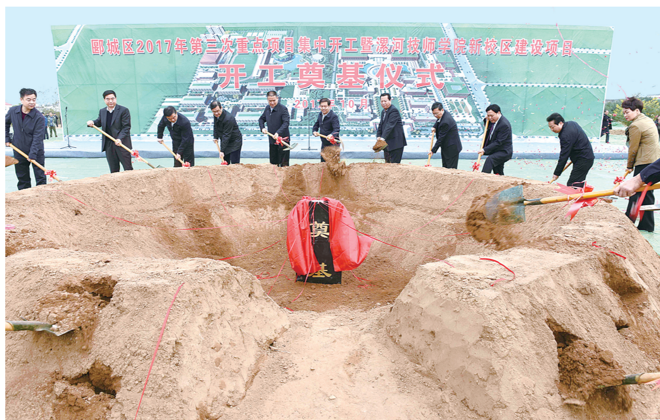
郾城区2017年第三次重点项目集中开工暨漯河职业技术学院新校区建设项目开工奠基仪式

这五年,是郾城区协调发展大统筹的五年,更是郾城区各项事业大步向前的五年。 着力推进产业与城市协调发展,集聚城市要素,提升城市功能。以会展中心为核心,以建业壹号商务中心、昌建国际金融大厦为依托,打造以会展商务、高端金融、广告创意为主的金融商务区,鼓励各金融机构开展“普惠金融、绿色金融、科技金融”等新型业务,努力打造全市金融高地;以黄河广场为支撑,以多条精品商业街和漯河迎宾馆、华山美食城等为引领,打造集名品名店、名牌服饰、餐饮服务于一体的