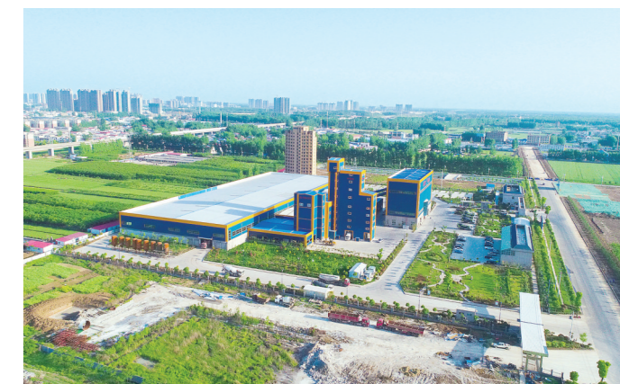
中联重科集团泰泰新型环保建材项目基地