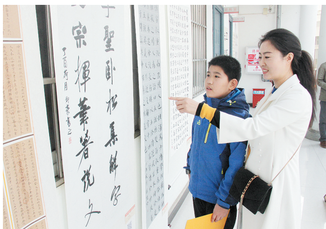
11月8日,由市政协教科文体委员会、市教育局、市文化广电新闻出版局、市文联共同主办的第四届“许慎杯”漯河师生书法作品展暨第二届篆刻展在许慎文化园展出,共展出171幅书法、篆刻作品。本报记者 李慧宇 摄