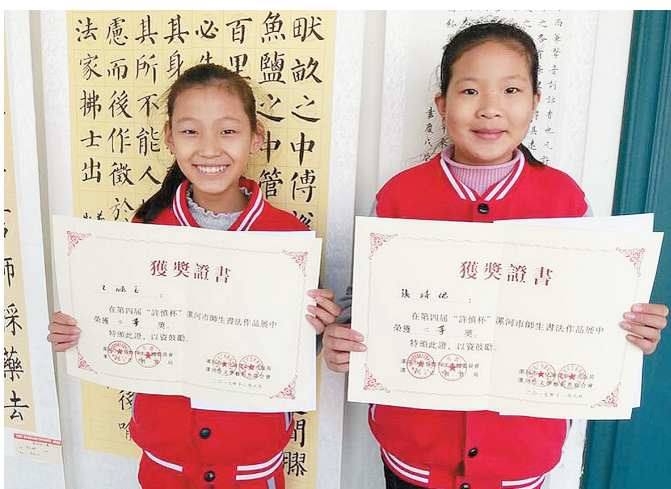
近日,召陵区程庄中心小学在第四届“许慎杯”漯河师生书法作品评选活动中获得多个奖项。