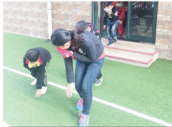
11月9日是全国消防日,市伊顿幼儿园组织幼儿进行了安全疏散演练,旨在通过演练活动教会幼儿学习逃生常识、锻炼幼儿的应急反应能力。