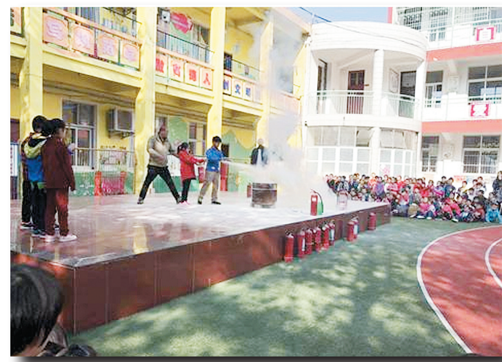
近日,源汇区泰山中路小学开展安全演练活动,拉开学校消防安全宣传教育月序幕。