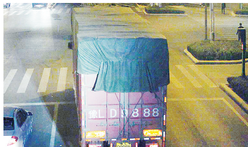
11月25日21:40,黄河路与金山路交叉口,大货车豫LD9888违禁入市,罚款200元、扣3分。