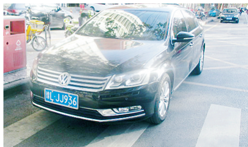
11月22日15:14解放路上占压斑马线,罚款200元。