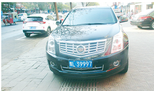
11月26日9:40五一路上占压盲道,罚款200元。