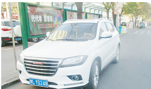
11月23日9:50五一路上占压公交车位,罚款200元。