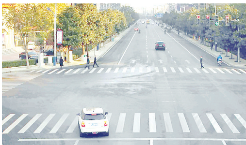
11月24日8:01,牡丹江路与嵩山东支路交叉口,豫LDD093闯红灯,罚款200元、扣6分。