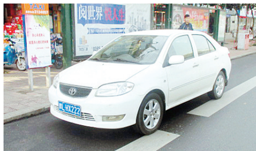
11月21日10:00辽河路上占压公交车位,罚款200元。