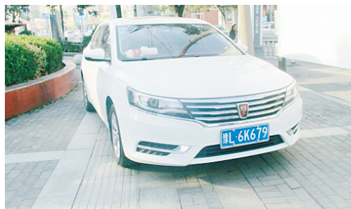
11月21日8:58太行山路上占压盲道,罚款200元。