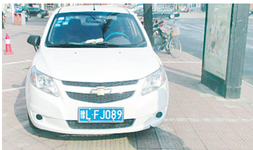
11月27日10:42崂山路上占压盲道,罚款200元。