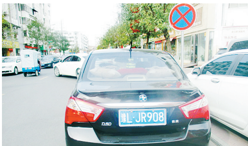
11月22日10:31老街上违章停车,罚款200元。