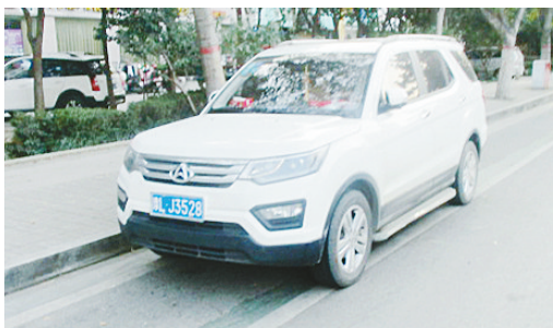
11月22日16:42长江路上占压绿道,罚款200元。