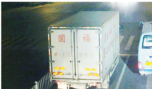
11月24日18:17,湘江路与峨眉山路交叉口,大货车豫LF0065违禁入市,罚款200元、扣3分。