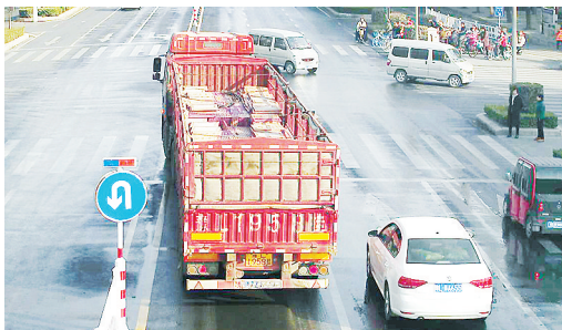
11月26日14:24,淞江路与太行山路交叉口,大货车豫L1958违禁入市,罚款200元、扣3分。