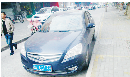
11月27日9:12滨河路上占压非机动车道,罚款200元。