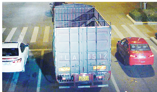
11月25日22:48,黄河路与金山路交叉口,大货车豫LA0512违禁入市,罚款200元、扣3分。