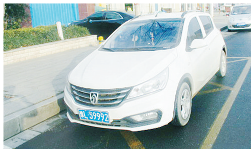
11月21日8:28金山路上违章停车,罚款200元。