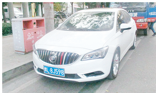
11月26日16:29长江路上占压绿道,罚款200元。