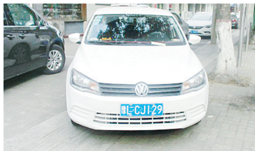
11月22日10:03祁山路上占压盲道,罚款200元。