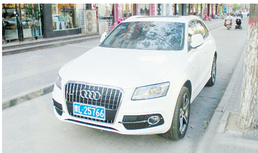
11月22日15:41泰山路上占压非机动车道,罚款200元。