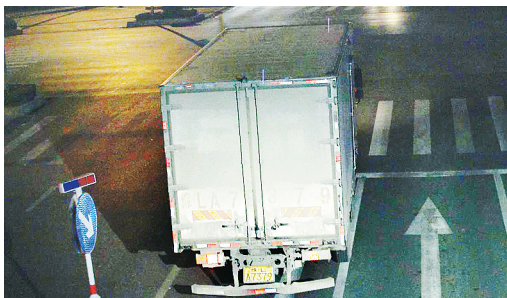
11月26日2:11,淞江路与太行山路交叉口,大货车豫LA7379违禁入市,罚款200元、扣3分。