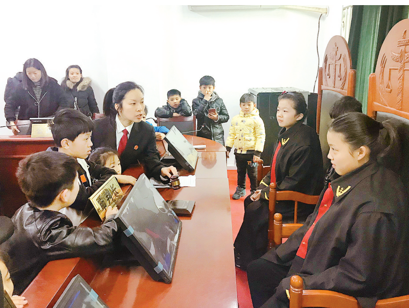
12月3日上午,源汇区人民法院组织开放日活动,邀请市妇联向日葵亲子读书会师生、家长50余人,走进法院参观学习,实地接受法制教育。见习记者 薛宏冰 摄