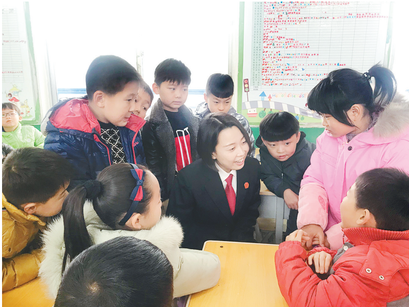
12月1日下午,市中级人民法院刑一庭法官受邀走进市实验小学DV直播间,以校园欺凌为题给同学们上了一堂生动的法制课,全校2000余名师生收听收看。图为课后,法官走进教室为同学们答疑解惑。