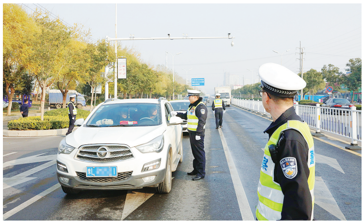
全市公安交管部门在限行区域内设置卡点加强管控,对违反《通告》的车辆进行查处。

张先生说。“绿色环保,这么多年第一次骑自行车,跟老公一起骑行,感觉很好。”在市区嵩山路与黄山路交叉口,李女士笑容满面地告诉记者。她的私家车牌照数字尾号也为单号,她跟丈夫便趁着周末,各自骑了一辆共享单车,准备环漯河一日游。