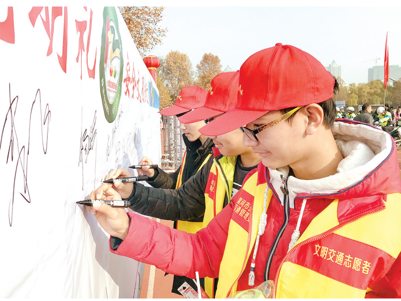
12月2日上午,由市文明办、市公安局、市网信办、市教育局、市司法局、市交通运输局等多部门联合举办的交通安全主题宣传活动,在市职业技术学院举行。相关职能部门代表、市民代表、驾驶员代表、志愿者代表等近3000人参加了活动。与会人员在集中观看了文明交通安全宣传公益片后,依次在印有“尊法守规明礼、安全文明出行”活动主题的签名布上签名。见习记者 薛宏冰 摄