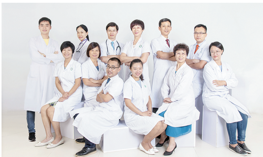
漯河市中心医院（漯河医专一附院）高血压科专家团队。

同时，该科积极配合全市计划生育委员会对市直、县乡、社区医生培训，如对市区、舞阳县妇产科医生培训妊娠高血压相关知识，降低母婴死亡率，受到广大妇产科医务工作者的好评。