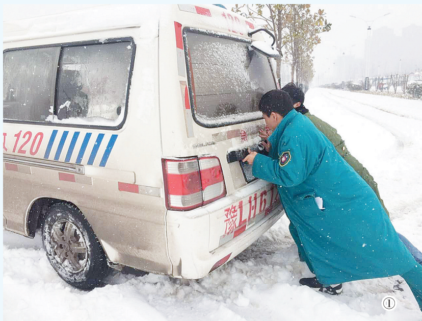
① 漯河医专二附院(市五院、市骨科医院)医护人员全力保障救护车正常出诊。徐景莲 摄

四是进一步加强医疗岗位值守保障工作。大雪期间,市“120”指挥中心与全市各大医院科学制订医护人员、急救车辆排班值守方案,充分做好急救车辆、救护设备的检修、维护工作,充足储备医疗耗材、应急物资,切实做到雪天组织健全、领导有力、反应迅速、救治高效,确保全市人民群众雪天就医安全。