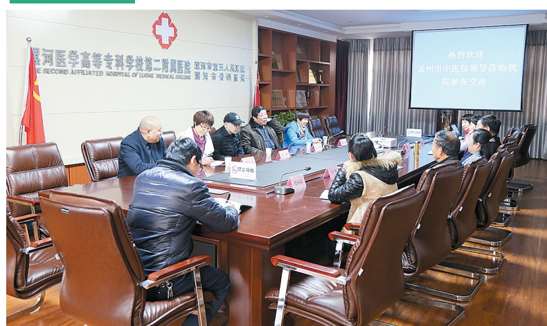
日前,孟州市中医院相关负责人一行4人,到漯河医专二附院考察学习临床路径管理工作,交流工作经验。