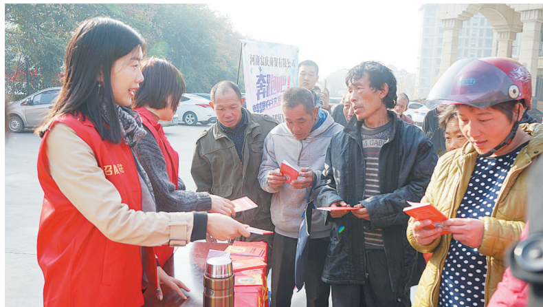
在农民工招聘会现场宣传解答与应聘相关人员密切相关的法律知识。