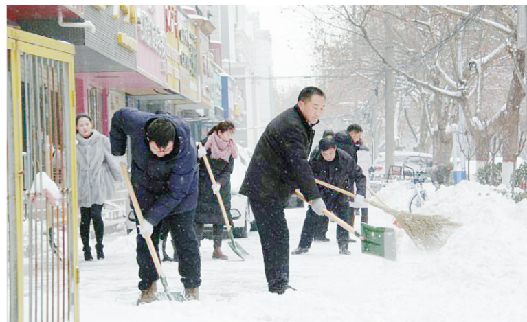
近日,郾城区人民法院集合全体干警,冒着大雪清除分包片区积雪,确保广大群众出行安全。