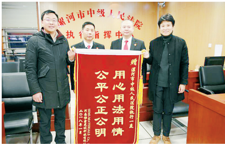
中韩企业双方送锦旗表谢意。

日前,韩国某半导体材料株式会社(下称韩方企业)与我市引进的某太阳能企业(下称漯河企业)同时来到市中级人民法院,送来一面写有“用心用法用情 公平公正公开”的锦旗,落款是双方当事人。原告双方同时送锦旗,在全市法院尚属首例,在全省乃至全国都极为罕见。