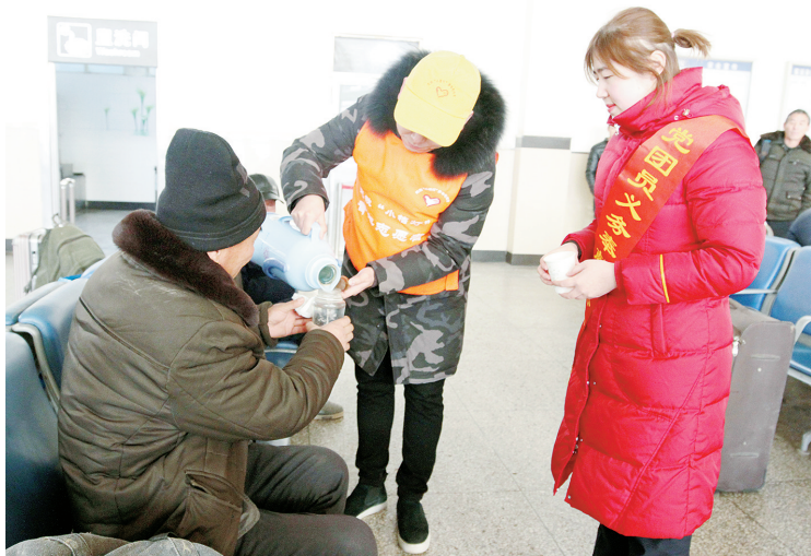
2月1日上午,漯河火车站举行2018年春运启动仪式,为期40天的春运正式拉开帷幕。启动仪式上,80多名党、团员志愿者进行宣誓承诺并签名。随后,志愿者们来到车站广场、候车大厅开展便民服务。

会上介绍了“中原风”河南省篆书作品展及全国第三届篆书展筹备情况、《河南省书法家协会专业委员会管理办法》及河南省书法家协会篆书委员会2018年工作计划。 2018年,河南省书法家协会篆书委员会主要开展以下工作:积极配合省书协、市有关部门与