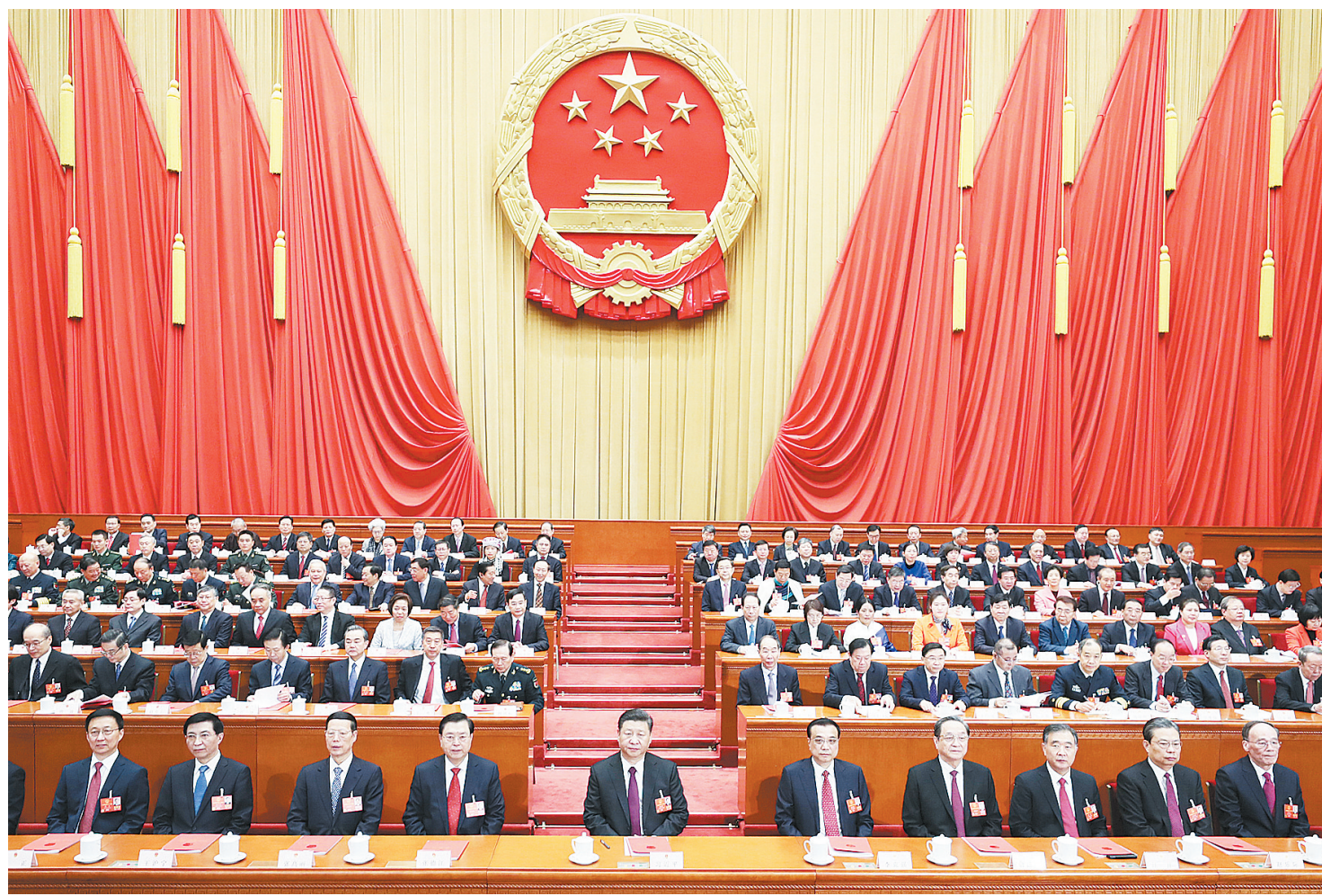
3月20日，第十三届全国人民代表大会第一次会议在北京人民大会堂闭幕。习近平等党和国家领导人在主席台就座。