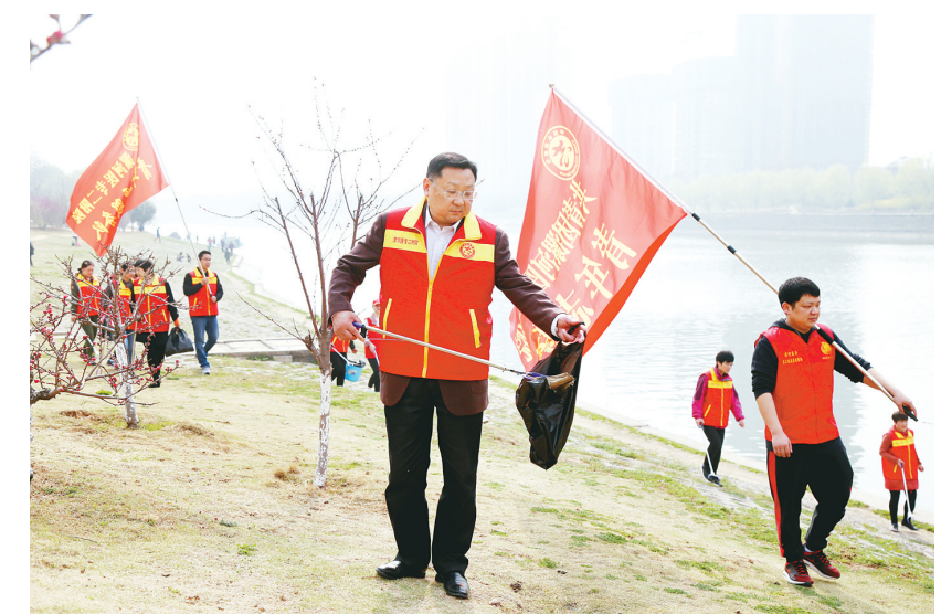
为弘扬志愿者精神,以实际行动传播绿色环保理念,近日,漯河医专二附院(市骨科医院、市五院)组织志愿服务队,到沙澧河沿岸开展“保护母亲河”志愿清洁活动。