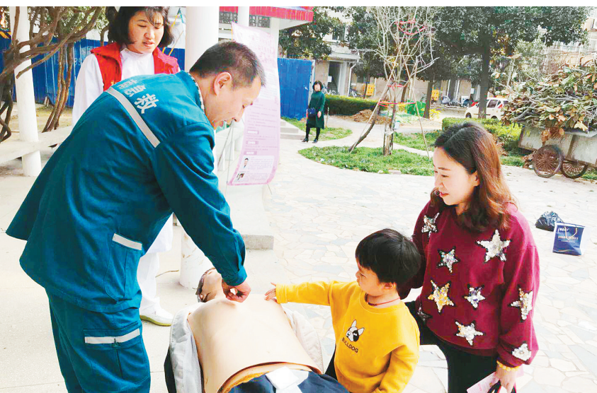
3月26日下午,市三院组织志愿者到电业局社区开志愿者服务活动,为小区居民进行健康义诊和急救知识培训,并就心肺复苏的操作过程和注意事项进行模拟示范。