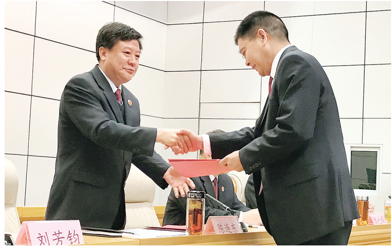
各县区院检察长向市人民检察院党组书记、检察长陈连东递交全面从严治党目标责任书、党风廉政建设和反腐败建设责任书。