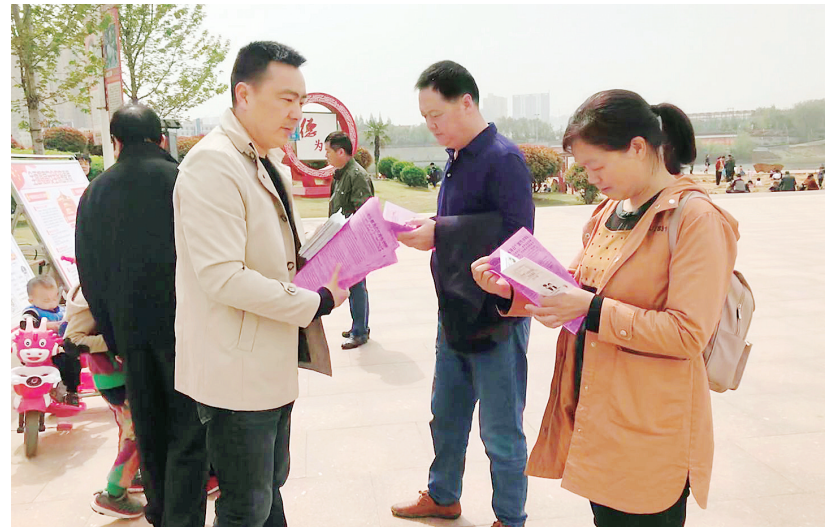
4月15日，我市在红枫广场举行以“开拓新时代国家安全工作新局面”为主题的全国国家安全教育日宣传活动。据悉，此次活动由市委政法委牵头，市国安办承办，市委办、市委宣传办、市网信办等全市30多个市直部委及单位共同参与，源汇区、郾城区、召陵区、临颖县、舞阳县也积极参与其中。活动中，他们结合自身实际开展了丰富多彩的宣传活动。

作为国家的法律监督机关，更要勇于监督自己。2017年，全市检察机关刀刃向内，严查检察人员违纪违法现象，给予2人党纪处分，辞退1人。会议强调，2018年，全市检察机关将继续加强党风廉政建设和反腐败工作，深入开展纪律作风教育整顿活动，并加强日常监督检查。把监督重心向司法办案一线延伸，坚决防止办金钱案、人情案、关系案，谋取非法利益。主动接受、大力支持派驻纪检组监督执纪。结合市人民检察院正在进行的纪律作风教育整顿活动和规范司法行为、全面从严治检、推动转型发展大讨论活动，坚持问题导向，整改落实问题，确保党建、队建真正取得实效。