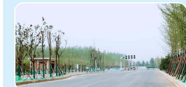
即将通车的牡丹江路