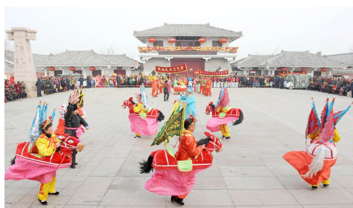
丰富的群众文化生活