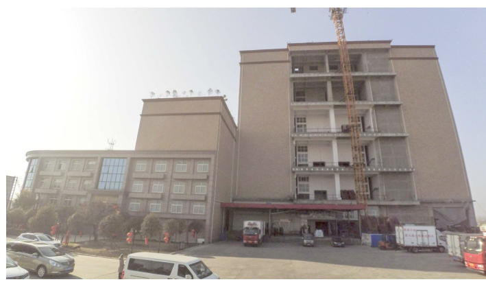
圆福仓储冷链物流项目