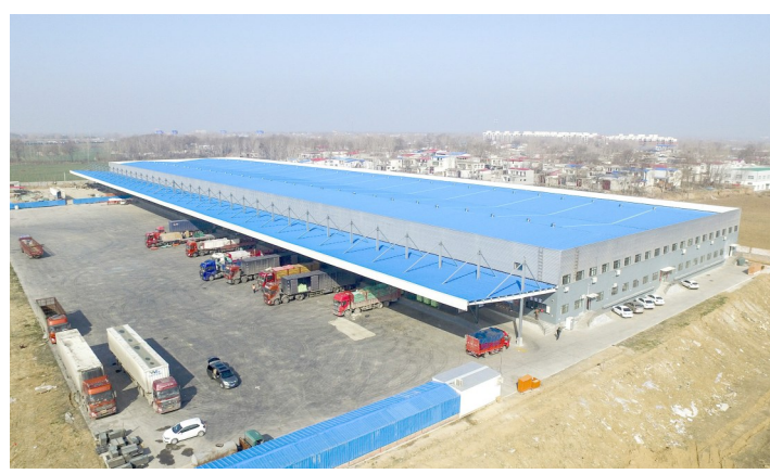
恒利源豫中南分拨中心项目