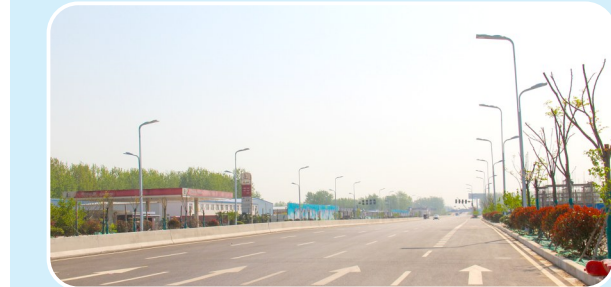
即将通车的龙江路示范区段工程