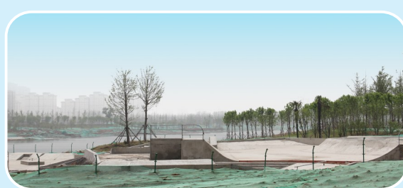
沙河西岸极限运动场施工现场