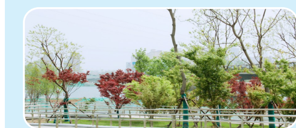
正在建设的沙河沿岸景观建设工程实景图