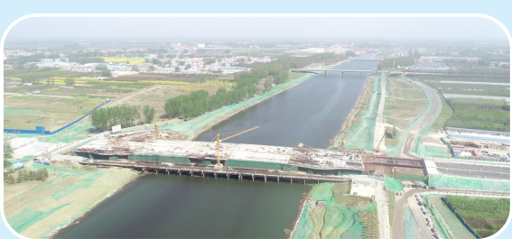
正在建设的牡丹江路沙河大桥项目