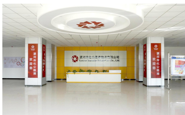
传化公路港物流项目