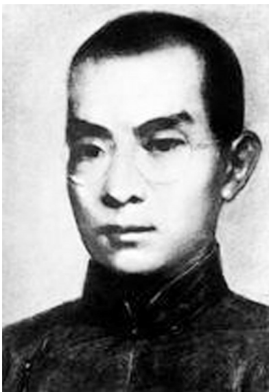
萧楚女像 (资料照片)