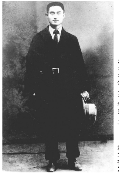
汪寿华像 (资料照片)