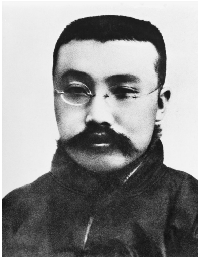
李大钊像 (资料照片)