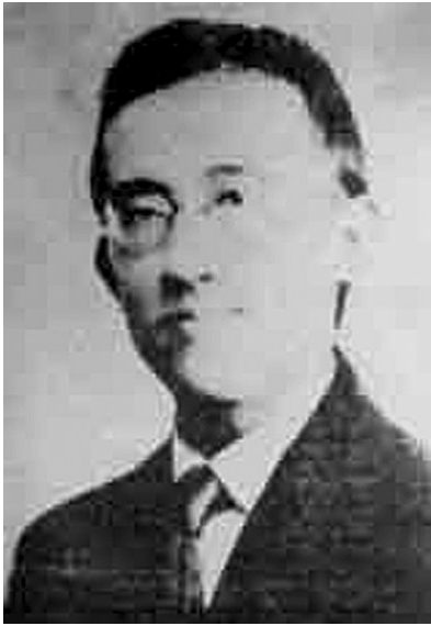
杨闇公像 (资料照片)