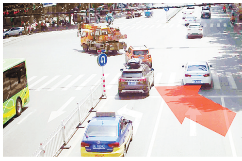
5月14日11:19,黄河路与邙山路交叉口,豫LRC055不按导向行驶,罚款50元、扣2分。