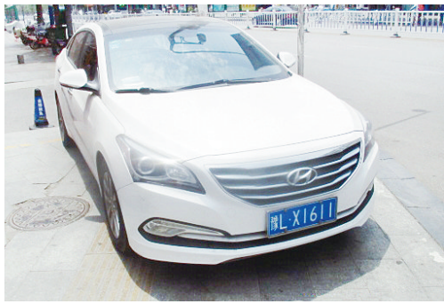
5月14日12:23交通路上占压盲道,罚款200元。