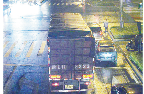
5月19日22:13,黄河路与金山路交叉口,大货车豫LH5222违禁入市,罚款200元、扣3分。