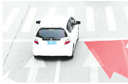
5月18日17:43,海河路与邙山路交叉口,豫LPP111违反禁止标线,罚款100元、扣3分。