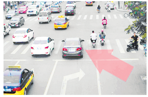
5月18日18:29,黄河路与太行山路交叉口,豫LQ666不按导向行驶,罚款50元、扣2分。