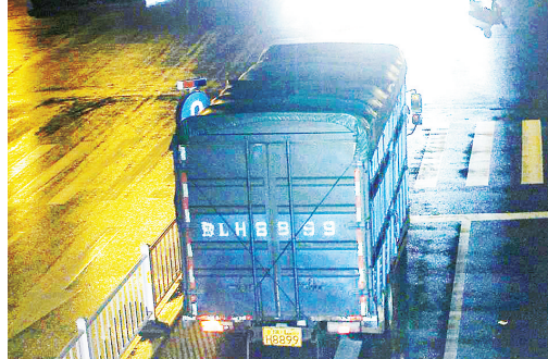
5月19日21:24,黄河路与金山路交叉口,大货车豫LH8899违禁入市,罚款200元、扣3分。