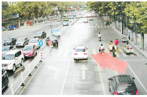
5月15日17:02,黄河路与邙山路交叉口,豫L7H581闯红灯,罚款200元、扣6分。