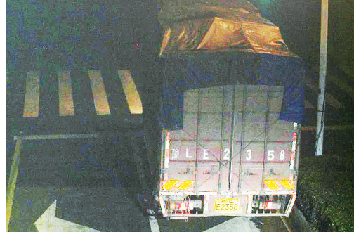
5月20日22:30,黄河路与邙山路交叉口,大货车豫LE2358违禁入市,罚款200元、扣3分。