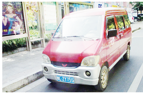
5月14日8:38嵩山路上占压公交车位,罚款200元。