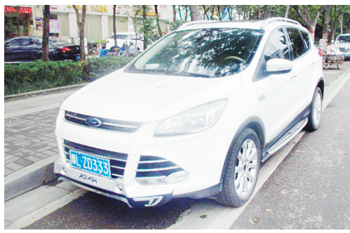
5月16日10:39长江路上占压绿道,罚款200元。