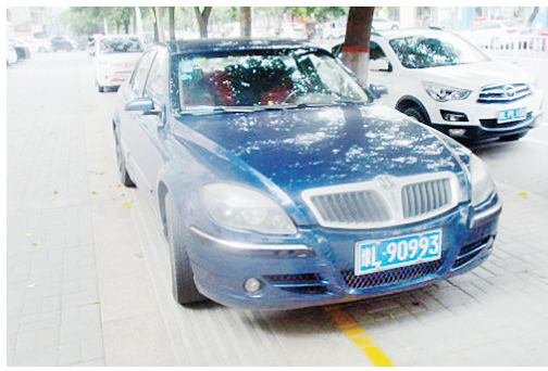
5月15日15:15五一路上占压盲道,罚款200元。