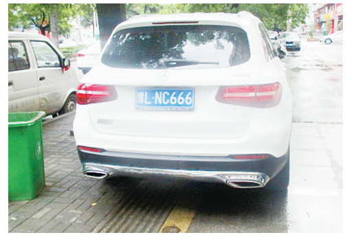
5月16日8:22建设路上占压盲道,罚款200元。