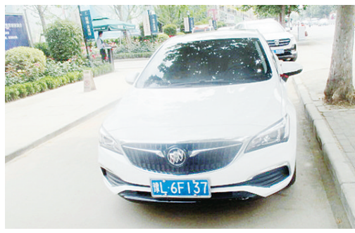
5月14日10:08人民路上占压非机动车道,罚款200元。