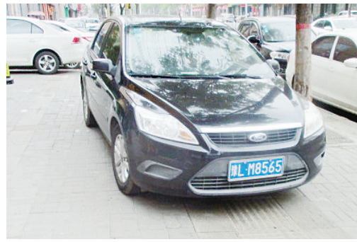
5月18日15:20舟山路上占压盲道,罚款200元。