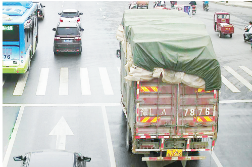
5月18日18:25,淞江路与舟山路交叉口,大货车豫LA7876违禁入市,罚款200元、扣3分。