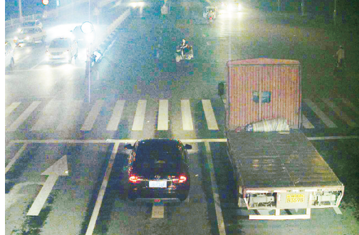
5月18日19:56,淞江路与舟山路交叉口,大货车豫LB3598违禁入市,罚款200元、扣3分。