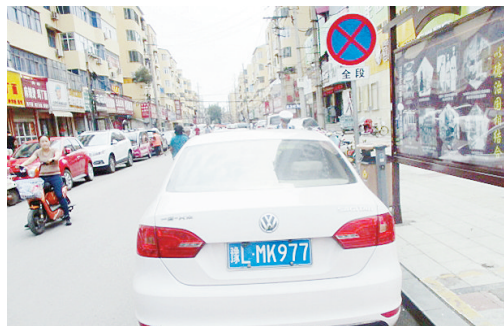
5月16日10:35受降路上违章停车,罚款200元。