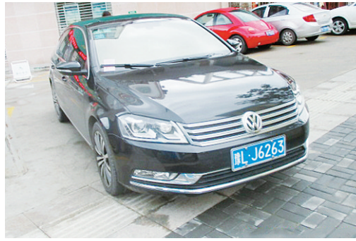
5月16日8:47海河路上占压盲道,罚款200元。