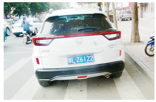
5月14日8:06五一路上占压斑马线,罚款200元。