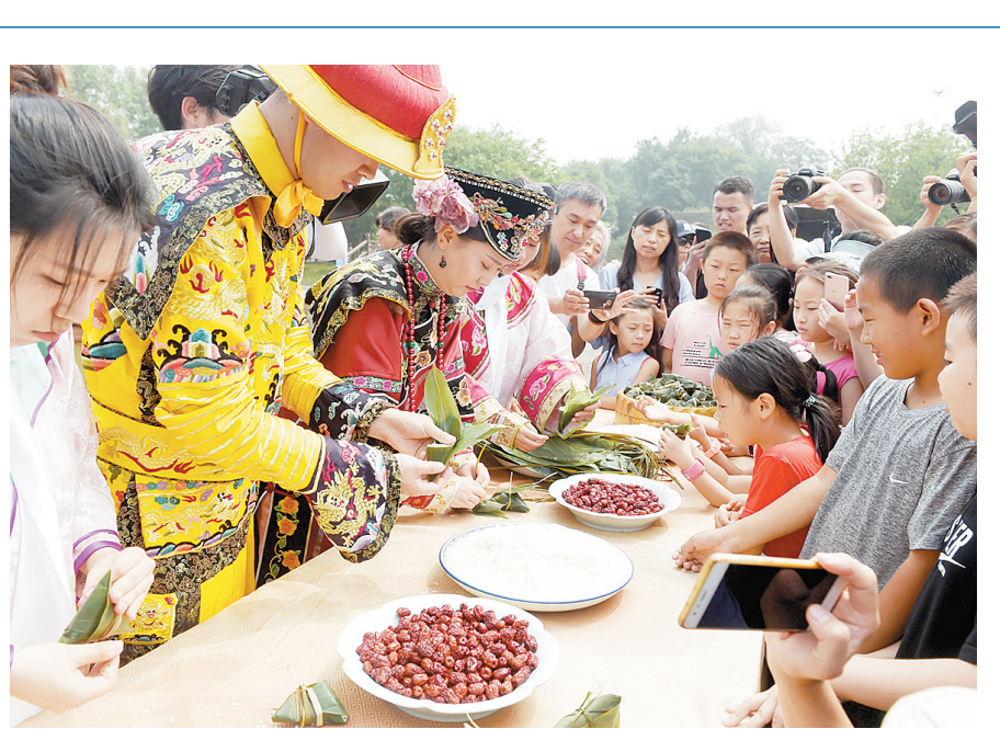
6月18日，在北京圆明园遗址公园，身着古装的工作人员和游客在一起包粽子。当日是端午节，各地举行多彩民俗活动迎接节日。

趁着天晴修屋顶 作为负责任的世界大国和全球第二大经济体，中国经济发展趋向牵动着世界神经。 从外部看，反全球化思潮和保护主义情绪升温，加剧了世界经济中的风险和不确定性。从内部看，中国社会主要矛盾已经转化为人民日益增长的美好生活需要和不平衡不充分的发展之间的矛盾。 经济稳中有进、稳中向好背景下，如何应对化解风险挑战？如何满足人民日益增长的美好生活需要？国际机构一致认为，中国应该“趁着天晴修屋顶”，经济再平衡很可能意味着总体增长有所减缓，但不应抗拒这种情况，而应该坚决贯彻已阐明的政策意向，将重点放在高质量发展上，不断切实改善民生。 仲夏之夜，星光点点。茶余饭后，生活在中部小城崇仁县的人们喜欢沿河散步纳凉，这在以往恐怕难以想象。从河内违法采砂、河边垃圾成灾，到两岸青草芬芳、小径洁净明亮，崇仁河的变化，是江西省抚州市“一河两岸”提升改造工程的缩影。“打好三大攻坚战，实现高质量发展，说到底是为了提升民众的获得感、幸福感。”抚州市委相关负责人说。 利普顿表示，鉴于中国过去几十年的成功改革以及中国政府的坚定承诺和决心，IMF相信中国能够实现经济的再平衡调整，转向可持续的发展模式。 世行报告则指出，尽管短期看中国的投资增速略有放缓，但“从国际和历史比较来看，中国投资增长仍属强劲”，中国应该着力改善投资配置、提高投资效率。世行发展预测局局长阿伊汗·高斯说：“只要中国继续深化改革，我们认为中国完全有充足的‘弹药’应对各类风险挑战。”