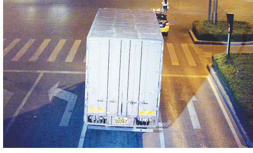
9月11日00:29,黄河路与金山路交叉口,大货车豫LD2267违禁入市,罚款200元、扣3分。