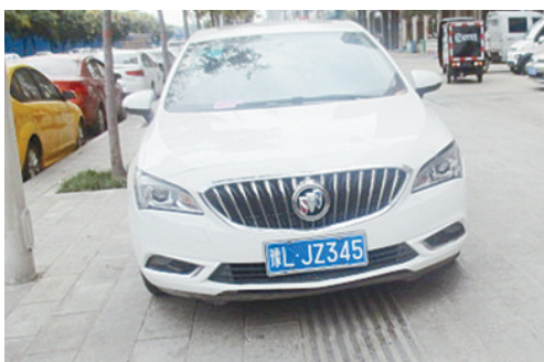
9月13日11:09黄山上占压盲道,罚款200元。