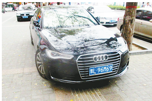
9月12日16:03建设路上占压盲道,罚款200元。