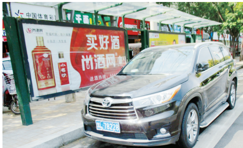
9月11日11:06辽河路上占压公交车位,罚款200元。