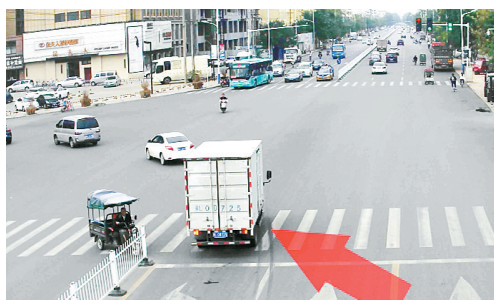
9月15日15:03人民路与燕山路交叉口,豫L0D725闯红灯,罚款200元、扣6分。