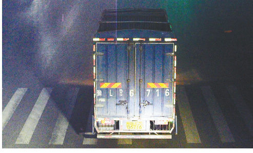
9月11日5:48,湘江路与峨眉山路交叉口,大货车豫LB6716违禁入市,罚款200元、扣3分。