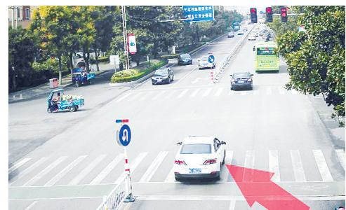
9月15日10:53长江路与祁山路交叉口,豫L9B327闯红灯,罚款200元、扣6分。