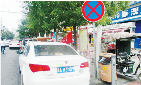
9月15日10:31交通路上违章停车,罚款200元。