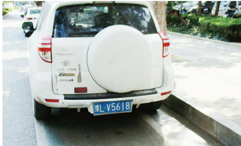
9月11日10:05长江路上占压绿道,罚款200元。