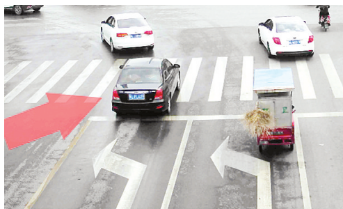
9月15日14:20淞江路与井冈山路交叉口,豫LFL639不按导向行驶,罚款50元、扣2分。