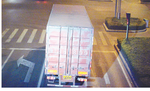
9月10日4:05,黄河路与金山路交叉口,大货车豫LJ6899违禁入市,罚款200元、扣3分。