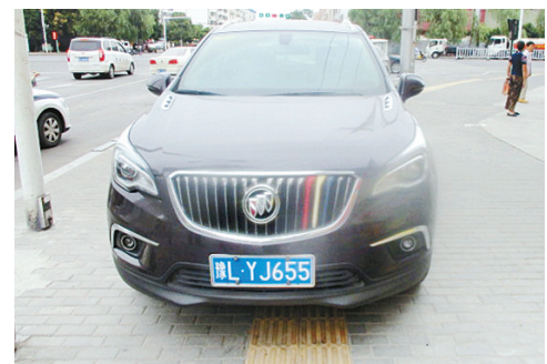
9月13日15:40漓江路上占压盲道,罚款200元。