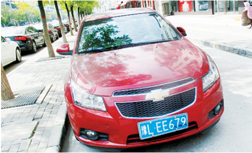
9月12日10:18泰山路上占压非机动车道,罚款200元。