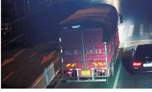
9月12日23:38,黄河路与邙山路交叉口,大货车豫LE5812违禁入市,罚款200元、扣3分。