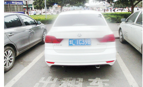
9月13日15:07公安街上违章停车,罚款200元。