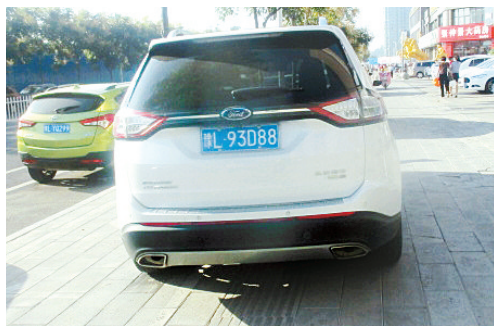
9月11日8:10黄山上占压盲道,罚款200元。