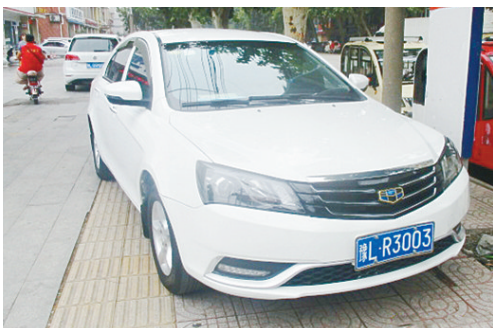
9月15日9:35解放路上占压盲道,罚款200元。