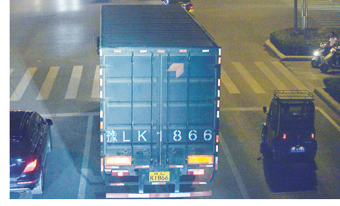
9月12日19:33,黄河路与金山路交叉口,大货车豫LK1866违禁入市,罚款200元、扣3分。