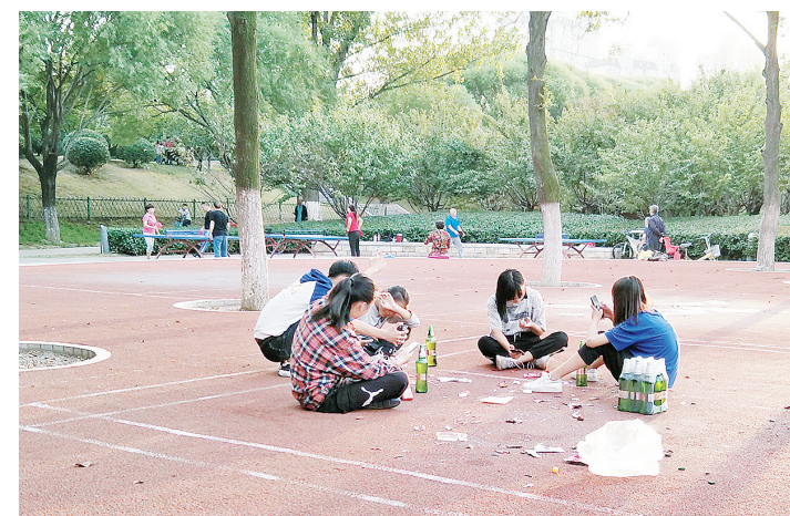
国庆假期,在沙澧河风景区,市民乱丢垃圾。

“宽进严管”的事中事后监管体系。 为推动人社领域各项惠民政策落到实处,市人社局从班子成员到一般党员干部,摒弃坐等上门、被动服务的思维,对全市规模以上企业深入开展以“送政策上门、解困难到家”为主题的“人社惠民政策直通车”行动。 深入实际,发现问题,解决问题。如今,在市人社局的示范引领下,全市人社部门正以工作重心下沉、服务关口前移的理念,努力推动人社服务再优化、再升级,不断增强企业和群众的幸福感、获得感。