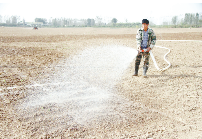
10月11日,源汇区大刘镇魏村农民正在浇地。近段时间,我市持续少雨,农民积极抗旱保苗。

持续开展打击“黑出租”和“非法网约车”专项整治行动,对出租车乱停乱靠、不打表、违规