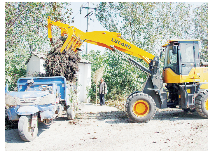
10月11日,舞阳县莲花镇禁烧队清运路边堆积的秸秆,消除安全隐患。

据介绍,“文化市场‘创文’攻坚百日行动”开展以来,通过加强“创文”宣传和不间断的集中整治,各文化娱乐经营场所“创文”意识普遍增强,环境得到很大改善,文化市场经营场所安全隐患得到进一步消除,但还有个别场所存在问题。对于检查中发现的问题,执法人员现场对经营业主进行批评教育,提出整改要求和整改期限,同时还对整改情况进行督查,确保文化市场秩序进一步好转。