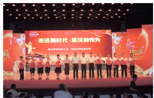
区委、区政府与教体局领导和参加庆祝改革开放40周年暨第34个教师节表彰文艺汇演的优秀教师代表合影留念。

郾城区教体局始终以“建设教育强区、办好人民满意教育”为目标,不忘初心、不辱使命,团结一心,奋力拼搏,不断书写郾城教育事业发展新篇章,为建设美丽郾城、开启新时代发展征程贡献力量。