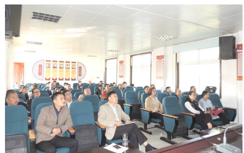
局机关党员干部参加主题党日活动。