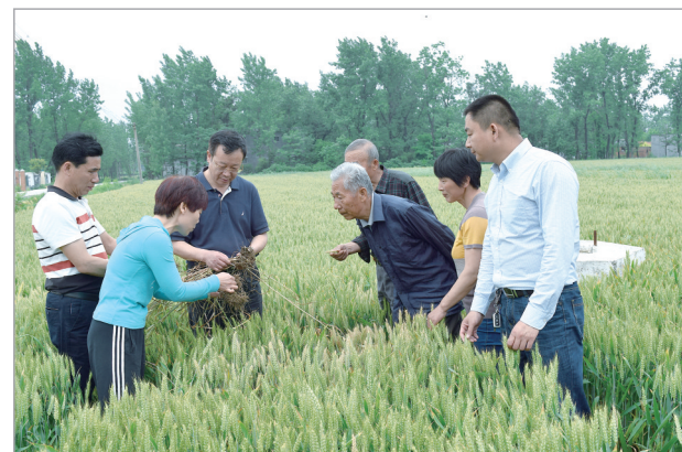
组织农业专家到田间指导小麦病虫害防治

“漯河市科协‘三大’以来的近五年,是科协工作与时俱进、开拓创新的五年。但这仅仅是一个开始,今后五年,市科协将紧紧围绕全市重大决策部署,主动作为,奋发图强,开拓创新,扎实工作,为加快推进‘四城同建’、全面落实新时代漯河经济社会发展‘四三二一’工作布局,以漯河更加