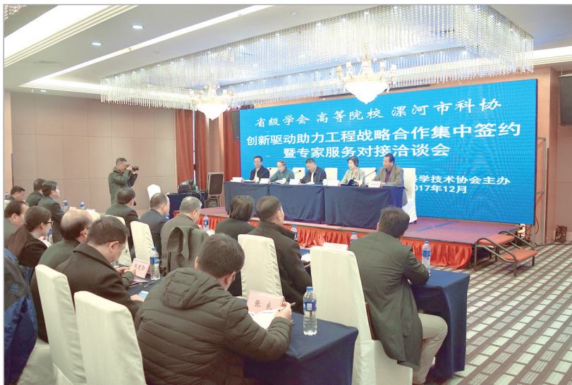
集中签约仪式暨专家对接洽谈会