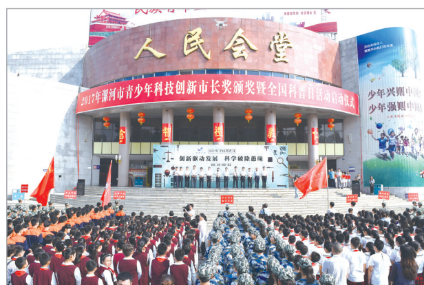
全国科普日主场活动