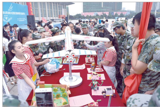
青少年科技创新成果展