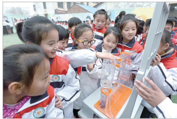
学生体验科普大篷车展品