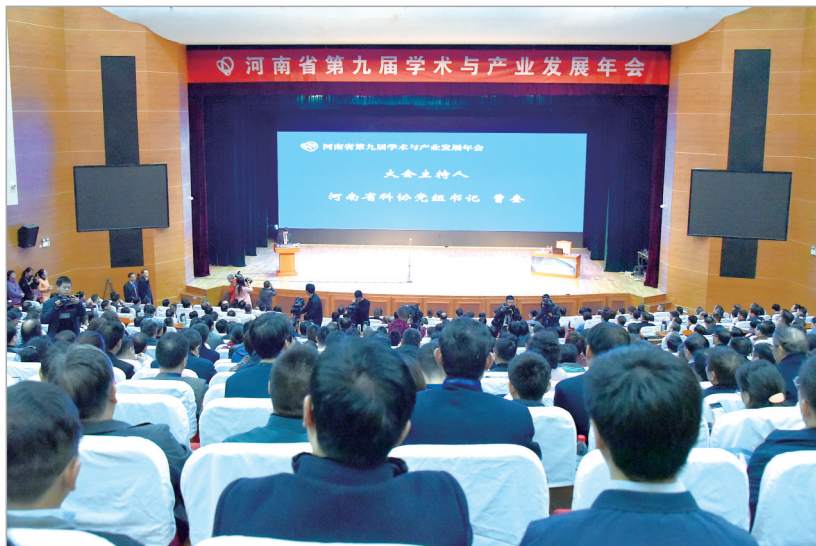
河南省第九届学术与产业发展年会主会场