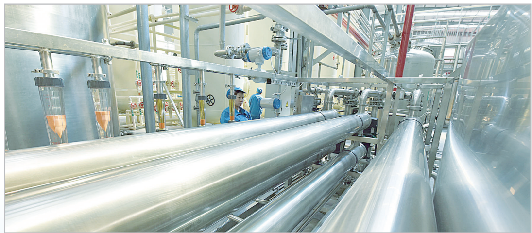
漯河源隆生物科技有限公司低聚糖生产车间。