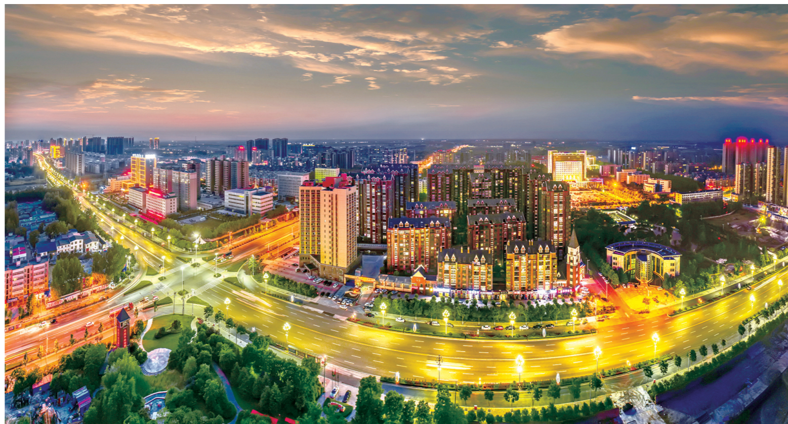
召陵行政新区夜景。