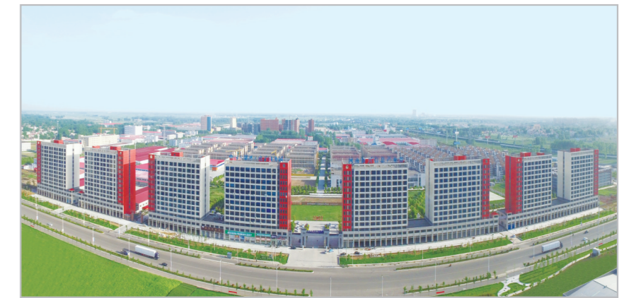
中国(漯河)电子商务产业园。