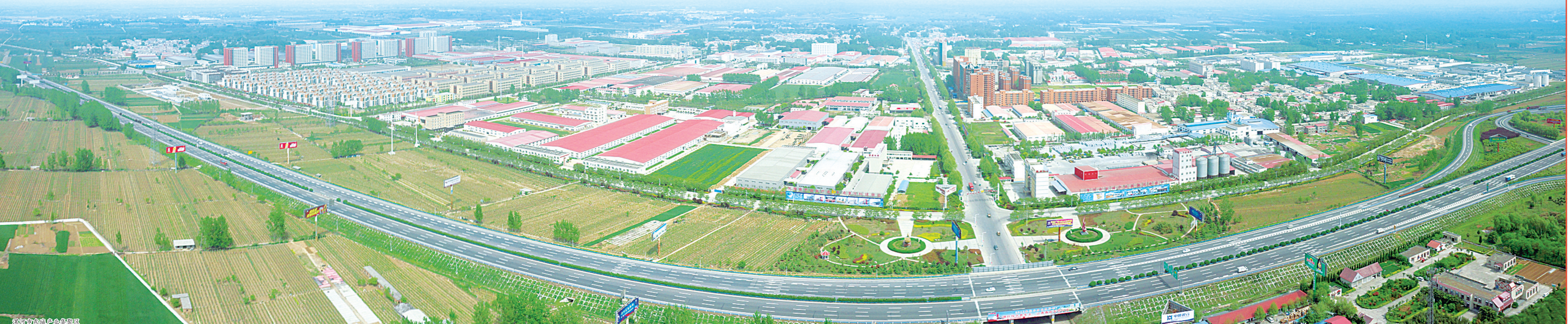
漯河市东城产业集聚区