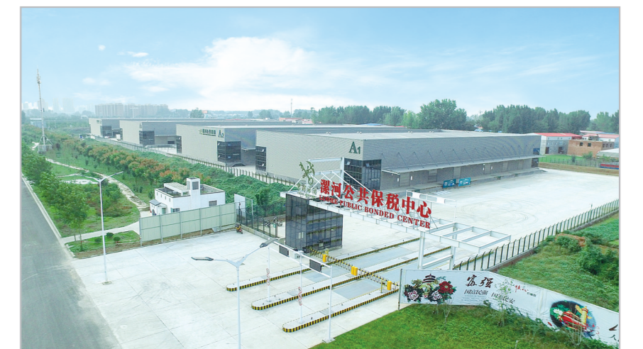
智能物联港公共保税中心。