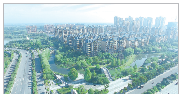
品味高雅的住宅小区。