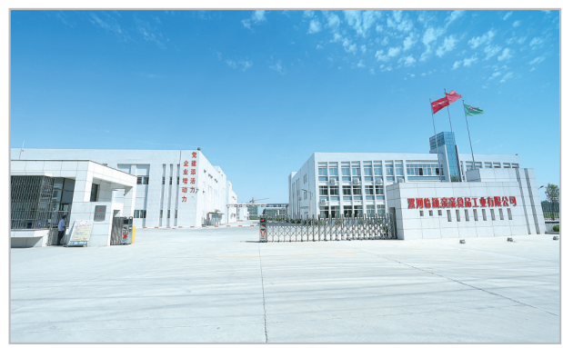
漯河临颖亲亲食品工业有限公司。

成绩只能代表过去,新的征程已经开启。临颖县将继续高举习近平新时代中国特色社会主义思想伟大旗帜,以决战决胜的信心、只争朝夕的劲头、坚韧不拔的毅力,弘扬“六拼”精神,在持续奋斗中书写新时代临颖全面跨越、全民富裕、全域美丽、全方位出彩的新篇章。