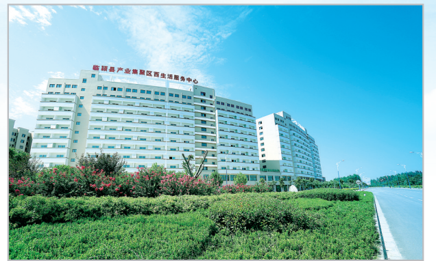
临颖县产业集聚区服务中心。

全年民生支出27.3亿元,占一般公共预算支出的86.2%;948项审批服务事项全部实现“网上可办”,91.2%的事项实现行政服务中心一窗分类受理;新增学位5040个;樱桃郭学校实现招生,黄龙学校加快建设,新增学位5040个;改(扩)建农村学校47所、幼儿园15所,完成改薄项目7个,建成乡镇教师周转房152套,安装农村中小学“班班通”1100套;新建社会办养老机构3家,148个农村幸福院投入使用;新建儿童之家100个;新增城镇就业12586人,完成年度目标170%;97个村天然气通村工程全面完成;深入开展扫黑除恶专项斗争,打掉涉恶犯罪集团3个、团伙6个,抓获犯罪嫌疑人102名。