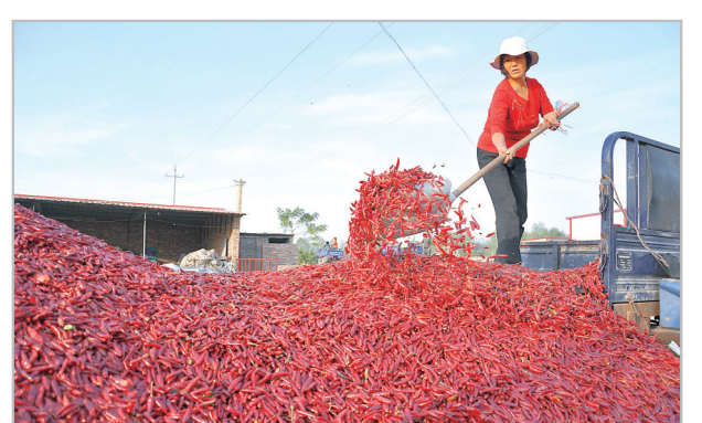
丰收的小辣椒享誉国内外。