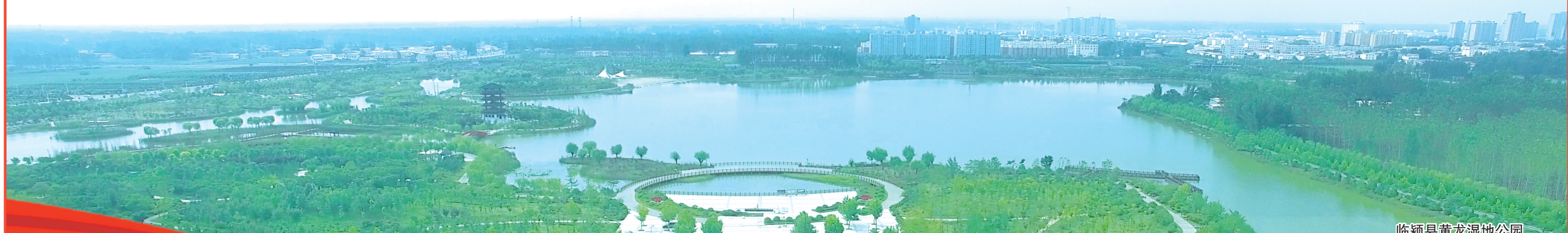
临颖县黄龙湿地公园

热烈祝贺 临颖县第十五届人民代表大会第三次会议 政协临颖县第十届委员会第三次会议 胜利召开