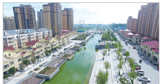
临颖县黄龙特色商业区。