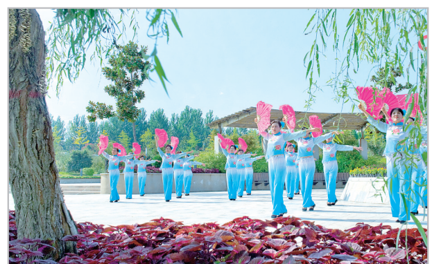
丰富多彩的群众文化生活。