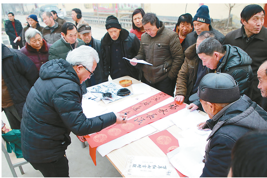
1月30日上午,漯河日报社组织人员到舞阳县马村乡华店村扶贫慰问,送去了慰问品,现场又写春联,还进行了慰问演出。