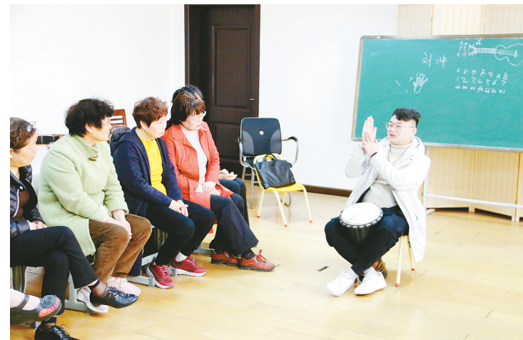
授课老师教会击打非洲鼓的手法。