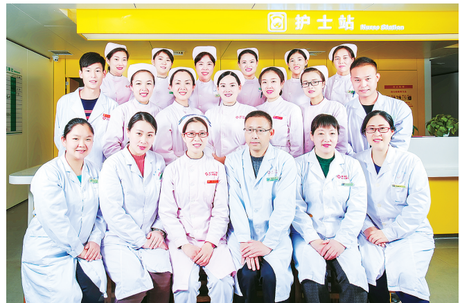
图为小儿康复科医护人员。

市二院小儿康复科作为省级重点培育学科、市级中重点专科，一直致力于患儿的康复治疗。针对儿童语言发育迟缓、口吃、构音障碍、失语症等各种言语障碍，2016年医院组建一支专业技